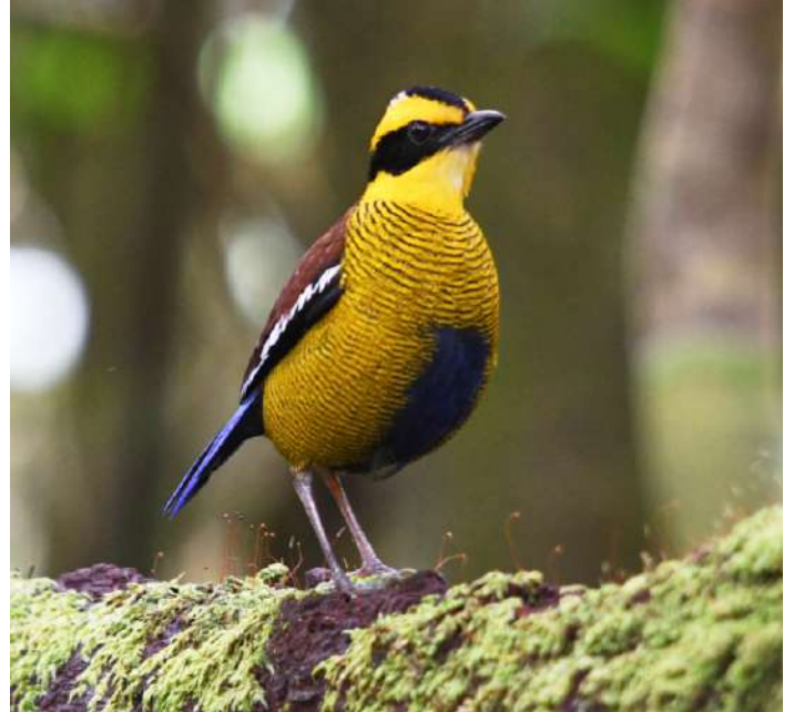
Bornean Banded Pitta.

20 september. Morgonskådning i Maliau Basin om tiden tillåter. Utcheckning och transport till Kota Kinabalu flygplats för hemresa.