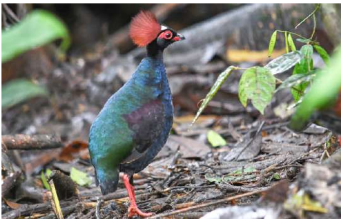
Crested Partridge.

15 september. Efter frukost blir det heldagsskådning vid ett gömsle för Bulwer's Pheasant. Ännu en art som nästan aldrig noteras på organiserade fågelresor. Här finns också andra exklusiva arter som Great Argus, Crested Partridge, Bornean Banded Pitta, Dayak Blue Flycatcher och Temminck's Babbler. Vi försöker även genomföra en night drive efter däggdjur här. Övernattninng på Borneo Jungle Girl Camp.