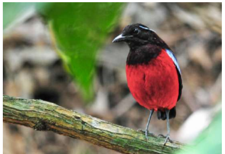
Black-crowned Pitta.

12 september. 2 kilometers vandring till ett gömsle för Peacock Pheasant. Här blir det heldagsskådning med medhavd lunch. Arten är mycket exklusiv och inte sedd av många. Men tålamod krävs och detta blir en av resans höjdpunkter. Bornean Crested Fireback och Bornean Short-tailed Babbler kan också ses här. Övernattning på City Hotel eller Crystal Hotel.