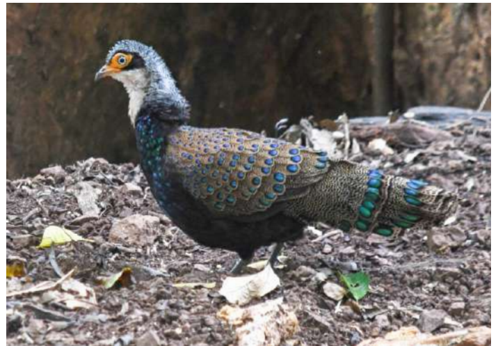
Bornean Peacock Pheasant.

10 september. Uppstigning i ottan för transport till Swine Hill. Vi tar med oss våra frukostpaket och beger oss till byn för registrering, träffa den lokala guiden och vandring (max en kilometer) upp till Swine Hill för Friendly Bush Warbler. Arten har en extremt lokal utbredning i buskmarkerna på bergssluttningen, men har den goda smaken att vara nyfiken och orädd för oss människor. Vi återvänder till Kinabalu Pine Resort för lunch och vila. På sena eftermiddagen far vi till Kinabalu Park för att hänga in eventuella missade specialare i den fina bergsskogen.