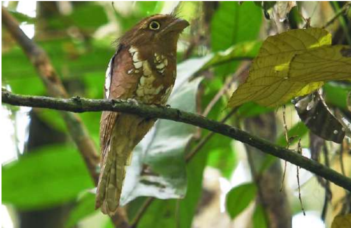
Bornean Frogmouth.

14 september. Från Tambunan tar vi oss till ett gömsle i Alab för de läckra hönsfåglarna Red-breasted och Crimson-headed Partridge. Om vi inte redan har sett den i Poring så besöker vi Rafflesia Center för att se världens största blomma: Rafflesia keithii (förutsatt att det finns blommande exemplar). Sedan blir det färd till Trus Madi för lunch och fågelskådning på eftermiddagen. Här har vi en god chans på Bornean Frogmouth, som normalt inte ses på sådana resor, men även Bornean Bulbul, Bornean Leafbird, Bornean Spiderhunter, Mountain Barbet, Bornean Barbet, Barred Eagle Owl m fl. Night drive för Clouded Leopard och andra däggdjur samt övernattninng på Borneo Jungle Girl Camp.