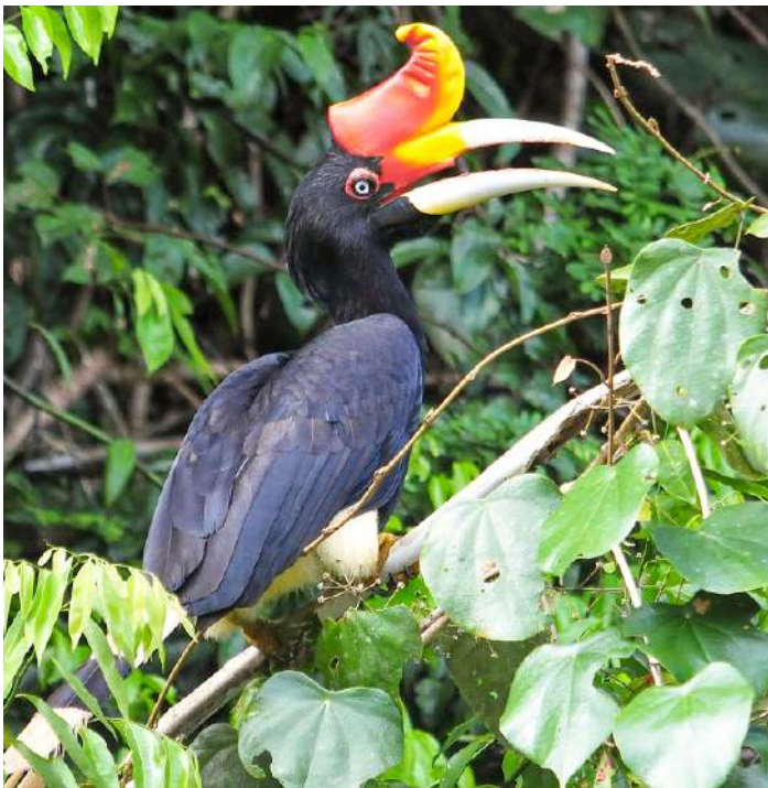
Rhinoceros Hornbill: Foto: Yeo Siew Teck

18 september. Ytterligare en heldag och kvällsturer. Både orangutang och Borneoelefant (pygméelefanter) ses ibland alldeles nära vårt övernattningsställe och på naturerna ses ofta kortsvansat piggsvin, rödbrun jätteflygekorre och stora lysmaskar. Natt på Maliau Basin Conservation Centre.