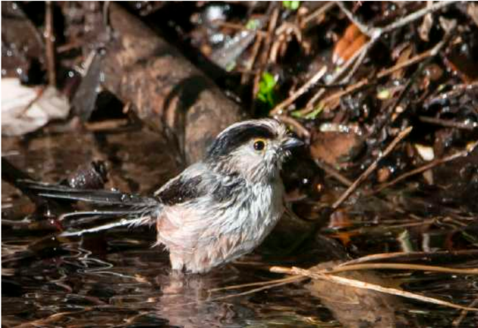
Stjärtmes (irbi).

Vi valde lite återbesök på platser där vi varit tidigare idag. Först ett stopp innan ravinen Penna Rossa, där vi fick riktigt fina observationer av moltonisångare, sydnäktergal och badande stjärtmesar (rasen irbi ). Vid ravinen sågs och hördes rödhönan och vi återfann några sardinska sångare och sammethättor. När vi intog fiket snurrade en aftonfalkhona över oss tillsammans med tre tornfalkar. På håll lät en göktyta och trädlärkor och de här på Korsika allerstädes närvarande nötväckorna!