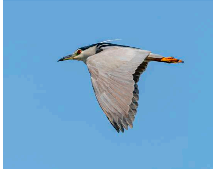
Natthäger.