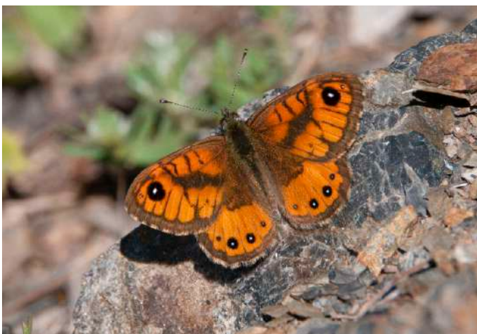
Pale Wall Brown.

Första dagen med solprognos för hela långa dagen innebär att nu skulle alla de unika dagfjärilarna få en chans. Ett bra beslut! Vi började dagen vid Col de San Colombano, som senast hade bjudit på max 50 meters sikt i dimman. Nu kunde vi vandra med milsvid utsikt till Monte Cinto. Vi valde att göra en brant men givande promenad upp till bergspasset och kunde nu få fina obsar på korsikansk siska vid en högt belägen kohage där också fältpiplärkor och trädlärkor höll till. En ödla längs vägen skulle vid fotografering visa sig vara den för Korsika och Sardinien unika Bedriaga's Rock Lizard, och en snabbt försvunnen makaonfjäril höjde pulsen. En "korsikansk svingelgräsfjäril", Pale Wall Brown, följdes av fler, och vi började förstå att det här d bli en fin fjärilsdag. Under vägen tillbaka hittade vi inom loppet av några minuter en Corsican Red Underwing Skipper och en Corsican Dappled White och lagom till fiket fick vi till slut fina fotolägen på en "hospiton", eller korsikansk makaonfjäril, som vi hoppats så mycket på. Fyra av de fem endemiska dagfjärilar vi har en rimlig chans på vid denna årstid!