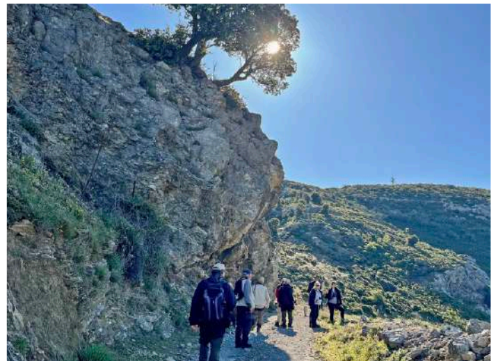
Col de San Colombano.

for vi rätt in i ett regnmoln. Från parkeringsplatsen lyckades vi ändå med bedriften att trots den dåliga sikten få se resans första korsikanska siskor, och ytterligare en moltonisångare. Nöjda med denna utdelning rullade vi ned till kusten och undan regnet till L'Île-Rousse och udden Île de la Pietra. Stora delar av området var tyvärr avstängt, vi intog därför den medhavda lunchen på klipporna nedanför ett hotell, men det tog inte många minuter innan både medelhavsliror och scopoliliror visat sig på godkänt avstånd, för ett tag i solsken. I strandkanten fiskade några toppskarvar samtidigt som medelhavstrutarna hoppades på turister som kunde tänka sig att dela med sig av tonfisksandwicharna. Mest överraskande