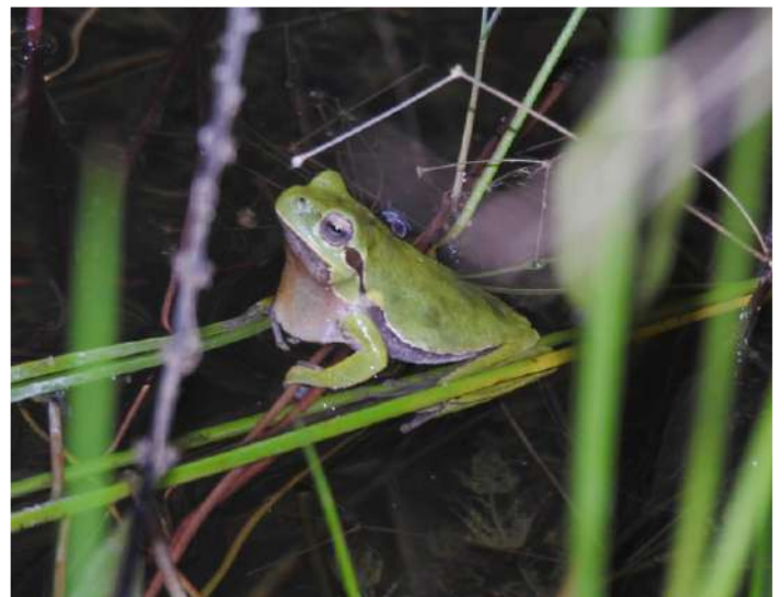
Tyrrensk lövgroda.

Hem för middag. Idag utmärkte sig förrätten: migliacci, en slags krispig ostkaka kolgrillad på ovanpå kastanjeblad. Några i gänget hade inte gett upp de tyrrenska lövgrodorna utan vi återvände till våtmarkerna nära Ekomuseet intill Étang de Biguglia. En dvärguv som också sågs hastigt lät så fort vi hoppade ur bussen. Vilken konsert som sen