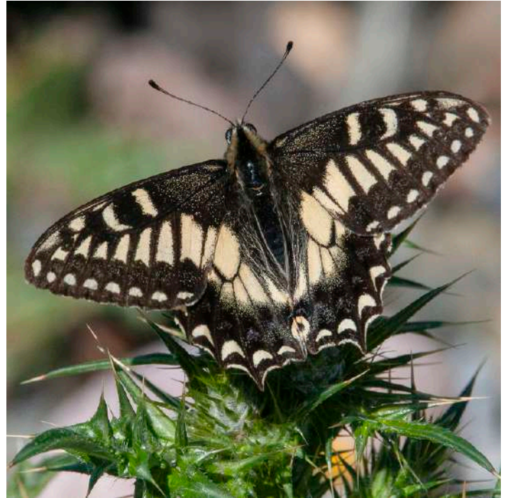
Korsikansk makaonfjäril – Hospiton.

Just som vi skulle hoppa in i bilen fick vi syn på en kungsrör rätt nära, spanande från högsta toppen i bergspasset. Partnern svävade ovanför. En värdig avslutning på första akten! På väg tillbaka fick vi syn på två törnskator från bilen. Landskapet såg intressant ut så vi stannade och tog en promenad i ett halvöppet beteslandskap längs en bäckfåra. Härfågel och turturduva spelade och snart fick den sällskap av en göktyta. Några hörde även rödhöna.