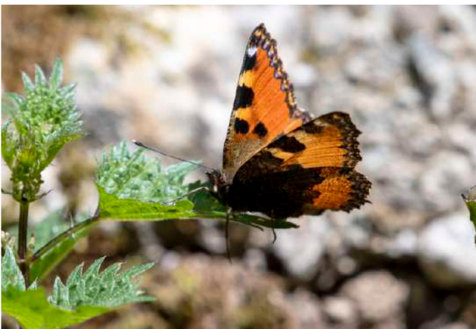
Korsikansk näselfjäril.

Efter denna sköna dag återvände vi för att få lite tid att njuta av lugnet i hotellträdgården, eller packa. Vi avslutade med fritt översatt "galtterrin", Lasagnes au Brocciu och en variant på Tarte Tatin.