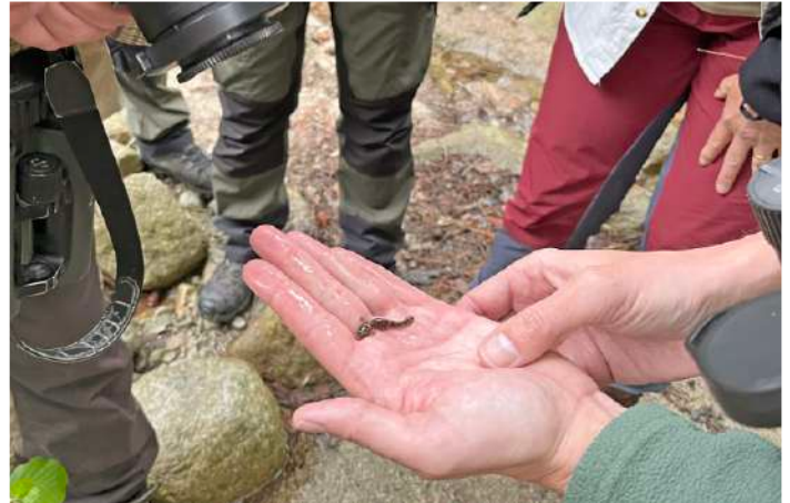
Larv av korsikansk eldsalamander. Foto: Ulrika Hamr n

Dagens sista stopp blev vid Ekomuseet intill lagunen  tang de Biguglia. En mycket trevlig plats d r vi ut kade artlistan rej lt. En m rkelig utfodringsplats f r kossor lockade  ven till sig 14 turturduvor, bronsibisar, drillsn ppor, en r rh na, gul rlor, en buskskv tta och stenskv ttor. Andra arter h r var bland annat purpurh ger, rallh ger, sandt rna och r dhuvade dyk nder. Tr tta men n jda  terv nde vi till v rt hotell f r  nnu en fin trer tters middag. Torsken med f nk lsgr dde och legymer var fantastisk.