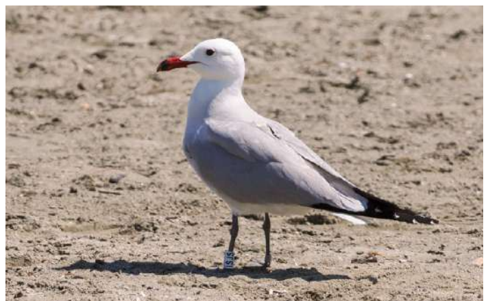
R dn bbad trut.

Det hade b rjat n rma sig lunchdags och vi besl t att  ka till  stra sidan av  tang de Biguglia. Vi fann en rastplats med n gra bord att sitta vid invid v gen med utsikt  ver havet. H r bevakade en ring- och GPS-s ndarf rsedd r dn bbad trut allt som skedde. Mutor i form av lite rostbiff fr n en lunchmacka gjorde att "ISJS" uts g oss till b sta kompisar,  tminstone tills n sta strandflan rer d k upp. Pav gjorde efter hemkomsten efterforskningar, och det visade sig att v r v n ringm rktes som adult redan den 16 maj 2017 p  den v stligaste spetsen av den italienska  n Pianosa, s der om Elba. Redan f r ett drygt  r sen observerades den f r f rsta g ngen vid stranden vi fann den p !