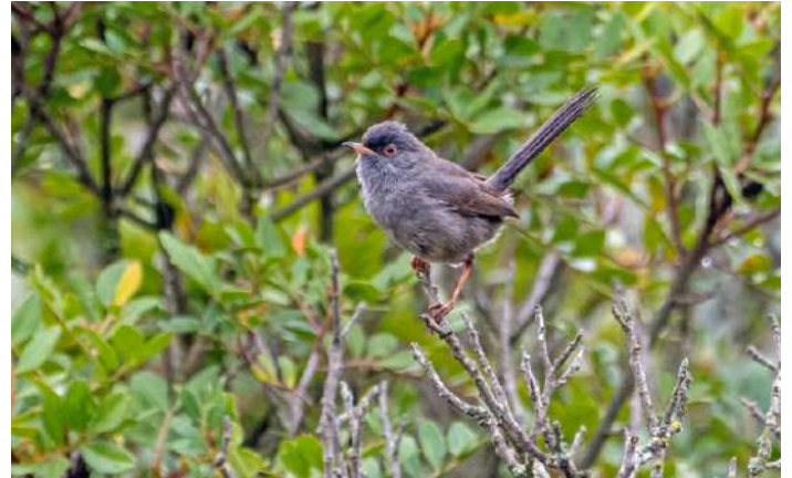
Sardinsk sångare.

Regnet upphörde framåt morgonkvisten och några hörde dvärguv från sovrumsfönstren i sorlet från morgonkonserten med koltrastar, gulhämpling, svartstarrar, svarthätta och sydnäktergal. Vi hade beslutat att ändra resrutten från reseprogrammet och styra kosan västerut med riktning mot L'Île-Rousse. Västra Korsika kunde till och med bjuda på solglimtar medan bergen och östra sidan utlovades ihållande regn. Vi låg länge före regnet, och ett stopp längs vägen mot Col de San Colombano gav resans första moltonisångare och häcksparv, samt härfågel och brandkronad kungsfågel. Därefter kom vi högre upp i bergen och skog ersattes av garrigue och odlingsmark. I vägkanten fick vi fina observationer av ett rödhönepar och kort därpå tyckte vi att landskapet såg så inbjudande ut att vi tog ett spontant stopp. Ett bra stopp, skulle det visa sig. Uppe i en ravin hördes en Sylvia sjunga på håll. Vi gjorde några tiotal höjdmeter i den riktningen och belönades med vårt första möte med två, tre sardinsk sångare, som både sjöng, lockade och exponerade sig kort, men fint. Innan vi lämnade platsen för att åka vidare gjorde reseledaren några fruktlösa span efter amfibier i en bäck medan Ulrika och övriga gruppen kunde studera en rödhuvad törnskata och ett par häcksparvar. Vi fortsatte sedan till bergspasset vid Col de San Colombano, men här