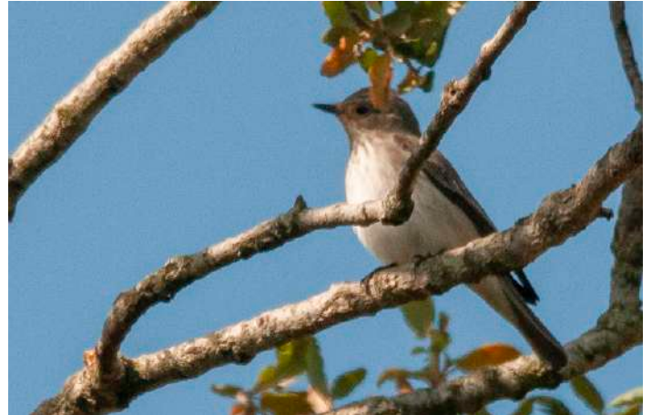
Tyrrensk flugsnappare.

Eftersom det hade gått så bra med inte minst fåglarna gjorde vi en tur delvis utanför programmet denna dag. Vi for till vin- och fruktodlingar nära Aghione, en timme söderut från Biguglia. Här finns en liten förvildad population av kalifornisk tofsvaktel, faktiskt den enda i Västra Palearktis. Den hörs ibland tidiga morgnar, och kanske var loppet kört redan eftersom solen nått upp en bit. Istället fick vi fina obsar av rödhuvad törnskata. Den enda endemiska fågeln vi inte lyckats med, tyrrensk flugsnappare, verkade enligt rapporter kunna ses i miljöer med träd nästan var som helst. Vi hade precis talat om strategier för arten när några i gruppen fann två i ett träd precis där vi hade ställt buskarna. Stor glädje, men samtidigt får vi ödmjukt säga att denna artbestämning inte hör till de enklare.