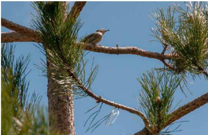
Korsikansk nötväcka.

Vi hade något mer hoppfulla väderprognoser idag och styrde kosan mot bergen, och Restonicadalen. Första stopp blev vid Tuani Camping där Pav under ankomstdagen rekat in ett par korsikanska nötväckor. Det tog inte många minuter förrän vi återfann dem på samma plats. Stor glädje, samtidigt som det visade sig vara en svår fågel att fotografera. Nötväckorna rörde sig nästan bara mellan tunna grenar högst upp i de redan rätt så höga svarttallarna i slutningen. Glada över resans viktigaste art förflyttade vi oss till några pölar där Pav med medtagen akvariehåv fiskade in en larv av korsikansk eldsalamander. Vi återvände till nötväckorna och efter ett tag hade några i gruppen högst oväntat lyckats få se en lammgam passera strax under molnen och bergsryggen. Tursamt nog kom den tillbaka efter bara några minuter och alla fick korta men skapliga obsar av denna fantastiska fågel, som numera bara häckar med några få par på Korsika.