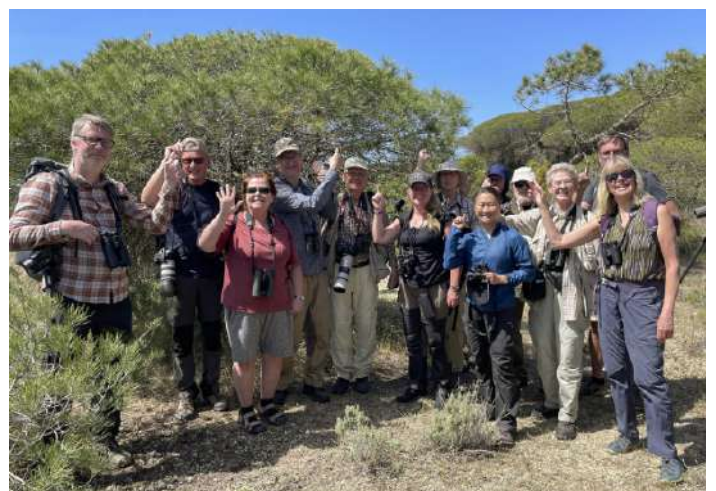
Alla glada efter att ha fått se Europas enda kameleontart