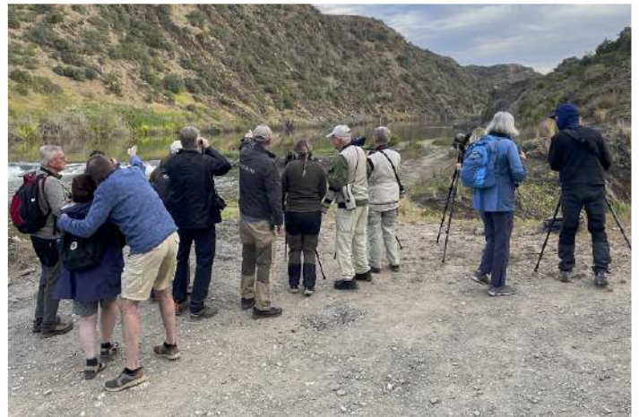
Gruppen spanar efter kungsörn

Ännu en härlig frukost med nypressad juice och nybakat bröd. Det var fortfarande lite kyligt i luften när vi kom till Canais nere vid stranden till floden Guadiana. En kungsörn satt på en klippa och väntade på solen. Det gjorde även klippsparv och blåtrast. När väl solen nått