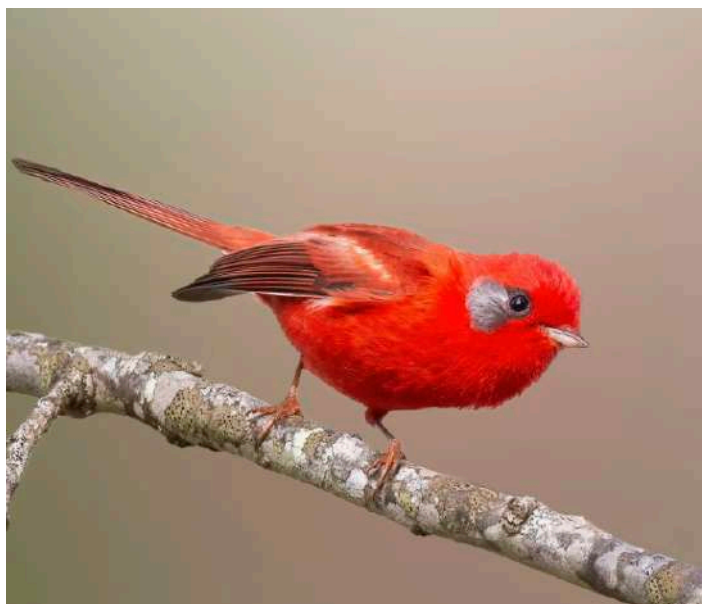
Red Warbler, Gray-eared form

29 mars. Sista morgonen med bergsfågelskådning innan vi beger oss ner till Mazatlán för att utforska regionala specialiteter där Sonorans öken och Sinaloa Thorn Forest möts, inklusive fågelskådning i mangroveträsk. Vi övernattar på strandhotellet Best Western Freeman Zona Histórico, Mazatlán, Sinaloa.