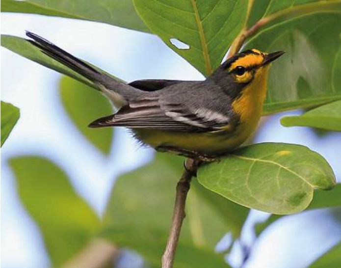
St Lucia Warbler

30 november. Redan klockan 04.00 lämnar vi hotellet, då vi hoppas se himlen förmörkas av St Vincent parrots. Det blir en lång körning till platsen som är otillgänglig, och vi skall bland annat korsa samma flod sju gånger på ditvägen. Men det är väl värt den tidiga uppstigningen och resan. Vi är tillbaka på hotellet till lunch och har lite tid för egna aktiviteter innan vi beger oss till flygplatsen och flyget till St Lucia. Här finns tid för lite sen eftermiddagsskådning innan middag. Natt på St Lucia.