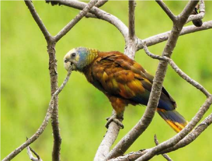
St Vincent Parrot

30 november. Redan klockan 04.00 lämnar vi hotellet, då vi hoppas se himlen förmörkas av St Vincent parrots. Det blir en lång körning till platsen som är otillgänglig, och vi skall bland annat korsa samma flod sju gånger på ditvägen. Men det är väl värt den tidiga uppstigningen och resan. Vi är tillbaka på hotellet till lunch och har lite tid för egna aktiviteter innan vi beger oss till flygplatsen och flyget till St Lucia. Här finns tid för lite sen eftermiddagsskådning innan middag. Natt på St Lucia.