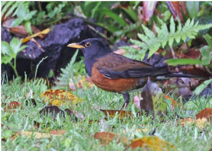
Izu Thrush.

Under förmiddagen gjordes ytterligare en fin vandring i Karuizawas Wild Bird Forest, framför allt för att försöka hitta Japanese Yellow Bunting. I en avlägsen del av skogen hördes sången från denna ovanliga fåltspärv och tillslut fick vi även se den – trägen vinner! Därefter avfärd mot Chiba-området, i låglandet norr om Tokyo. Under senare delen av eftermiddagen besöktes ett par våtmarksområden i Chiba, Nishi no Su och Ukishima. Åtskilliga Oriental Reed Warblers sjöng från vassarna, som avpatrullerades av Eastern Marsh Harriers. Japanese Reed Bunting syntes i vassens toppar och då och då gjorde Marsh Grassbirds sin korta "upp-och-ner-sångflykt".