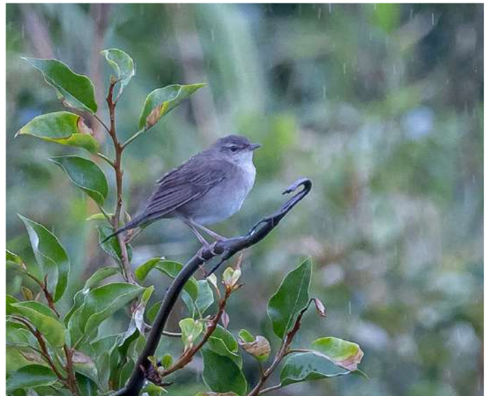
Styan's Grasshopper Warbler.

I gryningen närmade vi oss Miyake-jima, medan mängder av Streaked Shearwaters svepte förbi, lågt över havet. Klockan 05.00 steg vi iland på denna rätt lilla vulkanö, där det bland annat finns ett antal endemiska fåglar. Vi började med att besöka en liten sjö, Tairo-ike, samtidigt som det dessvärre började regna. Trots detta sjöng Ijima's Leaf Warbler, en lövsångarsläkting, lite här och där. Även endemerna Izu Thrush och Izu Robin noterades. Den endemiska mesen Owston's Tit var mera svårflörtad, men visade sig så småningom bra. En annan udda art är Styan's Grasshopper Warbler, som håller till rätt kustnära. Den fick vi se nära en liten fyr, där den trots det intensiva regnandet sjöng för fullt! Därefter bjöd den vänliga uthyraren av våra bilar på fika, samtidigt som regnet i stort sett upphört. Fågelmatningen var laddad och nu blev det fina obsar och foton på Owston's Tit och Izu Thrush, samt Grey-capped Greenfinch! Tidig eftermiddag embarkerade vi färjan och anträdde färden tillbaka till Tokyo. Havet var i stort sett lugnt och vi bjöds på havsfågelskådning i sex timmar med bland annat Black-footed Albatross, Tristram's Storm Petrel, Bonin Petrel (för en del lyckliga!) samt Short-tailed Shearwater i mängder. Även en Masked Booby passerade fint, innan vi anlände till Tokyo kl 20.00.