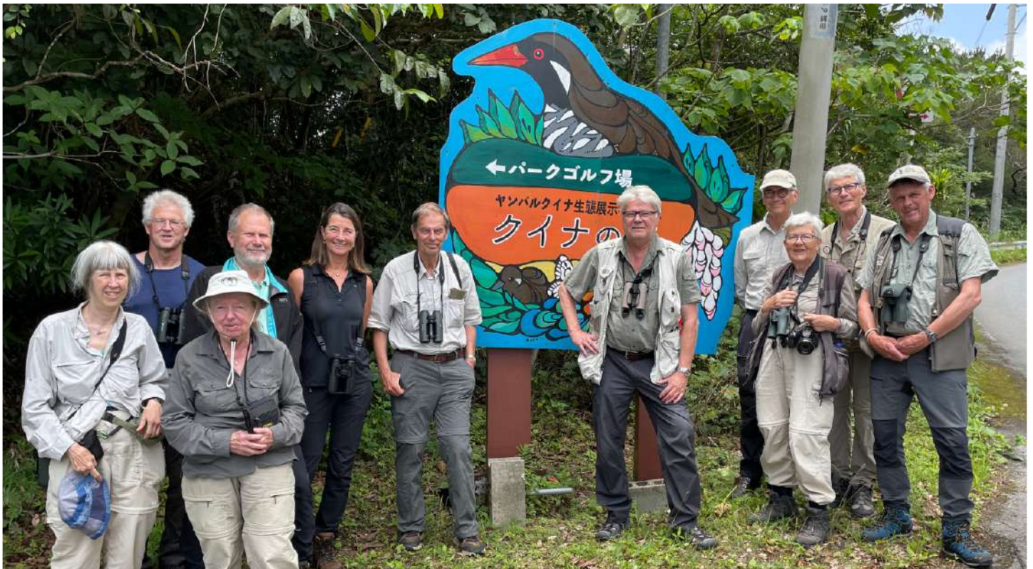
AviFauna-gruppen, Kunigami, Ada, Okinawa, 23 maj 2023.