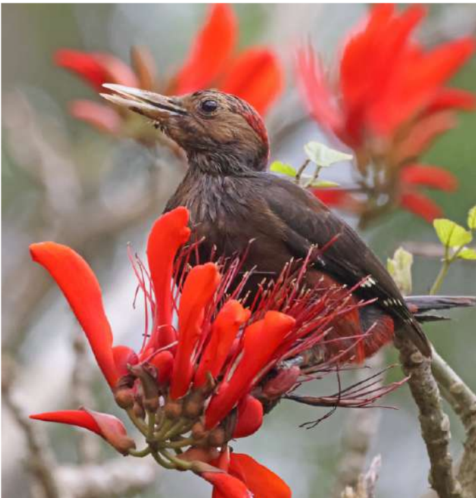
Okinawa Woodpecker.

Före frukost besöktes den vackra Hiji Falls Park, endast någon mil från vårt hotell. Den mest angelägna arten här var Okinawa (Pryer's) Woodpecker, en kritiskt hotad art, som har sin enda förekomst i Yambaru, den nordliga halvan av Okinawa. Denna speciella hackspett fick vi också se mycket fint! Tappra försök gjordes sedan att spela fram Okinawa Robin, som sjöng från den täta vegetationen, men den vägrade visa sig. På väg tillbaka till bilarna upptäckte en av deltagarna en orm som låg hoprullad i en kulvert, med tätt promenadvänligt galler som lock. Så ormsäkert som man kan begära! Ormen kunde efter foto-granskning bestämmas till Okinawa Pit Viper. Färden