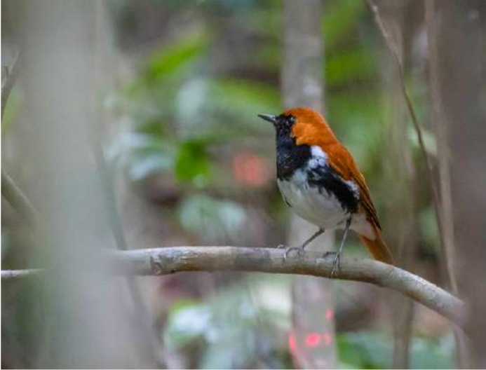
Ryukyu Robin.