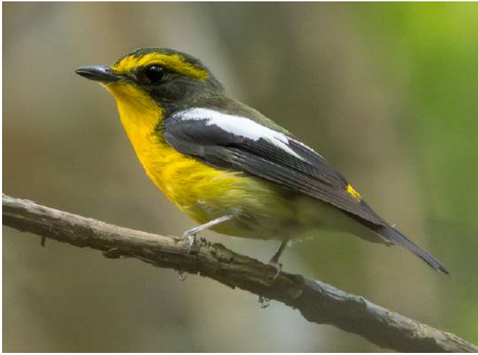
Ryukyu Flycatcher.