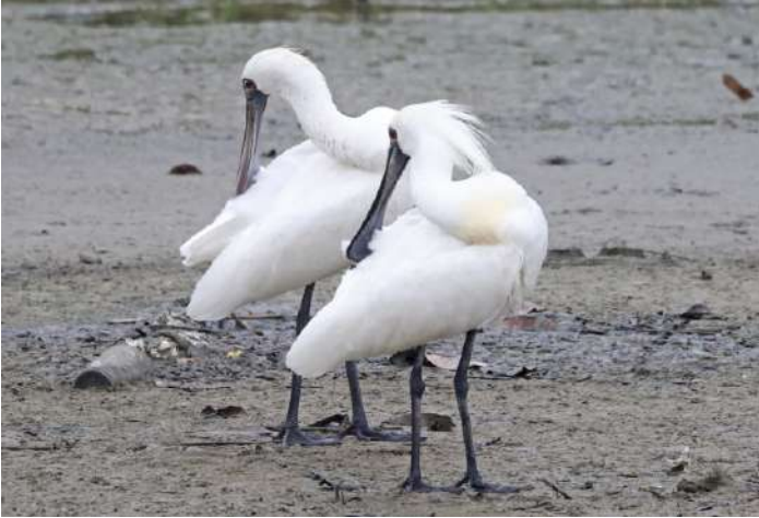
Black-faced Spoonbill.