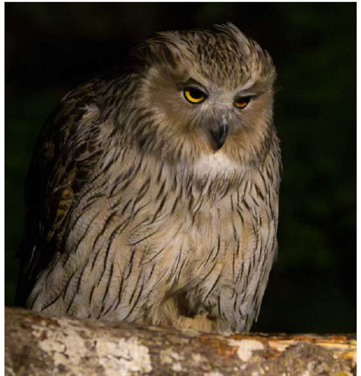
Blakiston's Fish Owl.

Det hade faktiskt blivit fredag och klockan var ca 00.45 innan Blakiston's Fish Owl äntligen behagade dyka upp och då visade sig fint för de fem tappra deltagare som fortfarande var vakna. Efter utcheckning från lodgen fortsatte resan mot Notsuke-halvön, en låglänt och långsträckt sandudd som sticker ut ett par mil i havet och är en fin fågellokal. I havet och i några grunda dammar sågs hundratals bläs-, stjärt- och skedänder, ett par Falcatid Ducks, samt ett par årtor, de sistnämnda ovanliga genomflyttare i Japan. I havet låg ett antal sibiriska knölsvärter och amerikanska sjöorrar. Red-crowned Cranes kunde beundras och fotas på flera håll. Middendorff's Grasshopper Warbler sågs och hördes för första och enda gången under resan. Likaså noterades resans enda Long-tailed Rosefinch, en långstjärtad och vacker rosenfink. Notsuke bjöd även på en flock om ca 25 Chestnut-cheeked Starlings och ett mindre antal Russet Sparrows. Det blev alltså ett synnerligen givande besök på Notsuke! Vår sista kväll på Hokkaido tillbringades i Nemuro.