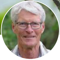
Foto rubinnäktergal och Oze Beach: Matts Ekman; Fuji-san: C-A Bauer