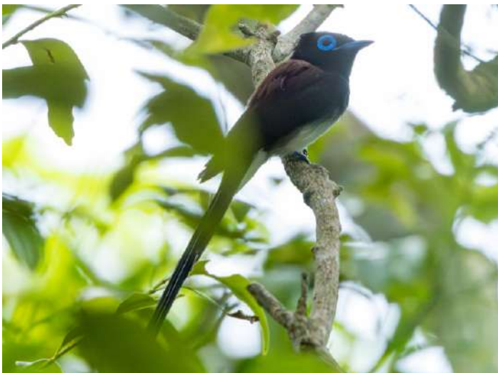
Japanese Paradise Flycatcher.

Brown-eared Bulbul, som var vanlig, och "Ishigaki Tit", en udda ras ( nigriloris ) av Japanese Tit och ett framtida potentiellt split. Vidare till Kasada Forest, med tät vegetation, där vi dock så småningom fick se en grann hane av Ryukyu Flycatcher och både Common Emerald Dove och Ryukyu Green Pigeon. I ett öppet område fanns Malayan Night Heron och en White-breasted Waterhen. När skymningen föll på hördes Northern Boobook och Ryukyu Scops Owl.