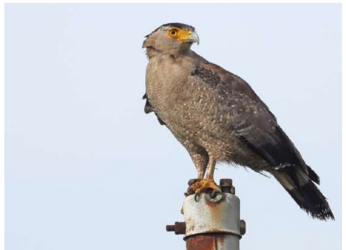
Crested Serpent Eagle (ssp. perplexus).

Under några tidiga morgontimmar besöktes åter Kasada Forest, vilket bland annat gav den långstjärtade Japanese Paradise Flycatcher och Ryukyu Flying Fox. I öppnare marker hittade vi Crested Serpent Eagle av rasen perplexus , som ofta anses vara en egen art, Ryukyu Serpent Eagle. Pacific Swallow, Ryukyu Green Pigeon och Light-vented Bulbul var rätt vanliga arter. Efter en lite sen frukost bordade vi en snabbåt till den närbelägna ön Iriomote, ytterligare ett snäpp närmre Taiwan. Överfarten bjöd på fina obsar av åtskilliga vackra Black-naped Tern, några rosentärnor, samt både Greater Crested Tern, Bridled Tern och Brown Booby. På Iriomote gjorde vi en vandring i tät skog, med tropisk känsla och mängder av vackra fjärilar. Målarten här var Iriomote Tit, men trots intensivt spanande