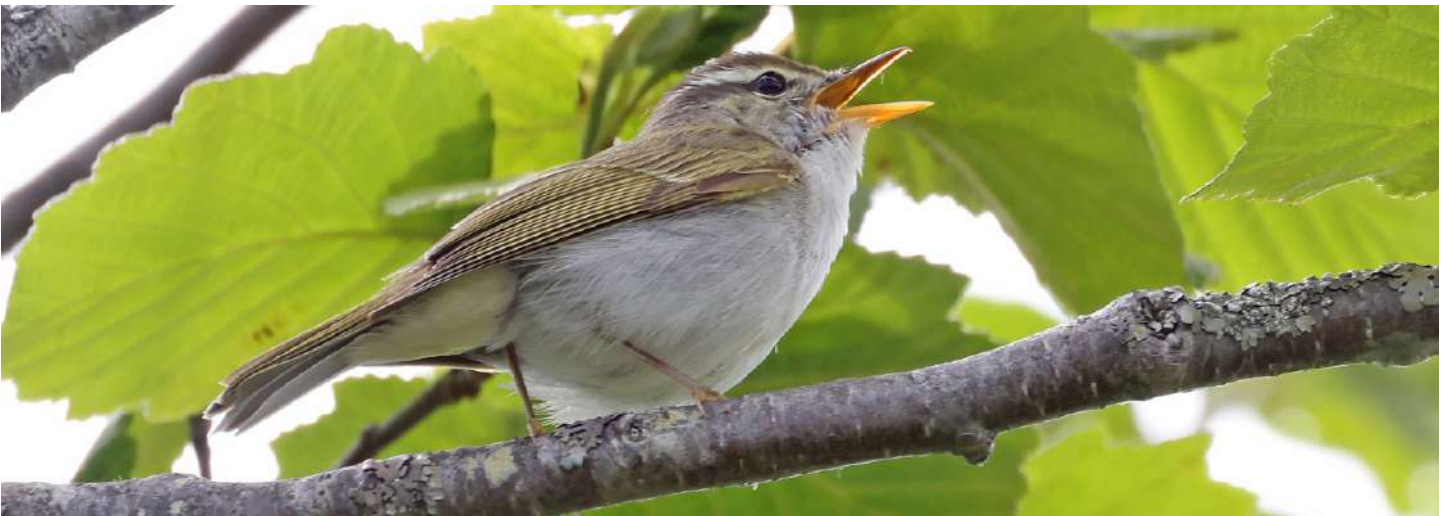
Eastern Crowned Warbler.

Karuizawas Wild Bird Forest är ett mycket fint skogs-område, med högre skog och fin undervegetation, där vi gjorde flera längre vandringar. Fyra arter gök hördes, liksom slaguggla, som vi så småningom även fick se. Den endemiska spetten Japanese Green Woodpecker var svårflörtad, men till slut fick vi se ett ex, om än på rätt långt håll. En annan eftertraktad art, Japanese Yellow Bunting, en fåtalig sommargäst till Honshu, lyckades vi trots intensiva försök, inte få se denna dag. Sent på eftermiddagen gjordes en biltur till lägre höjd för att besöka Ura-Myogi, ett område med spektakulära bergsformationer, där vi i skymningen fick se och höra Grey Nightjar.