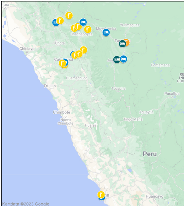
Fågellokaler under resan. Se dag-för-dagprogrammet.