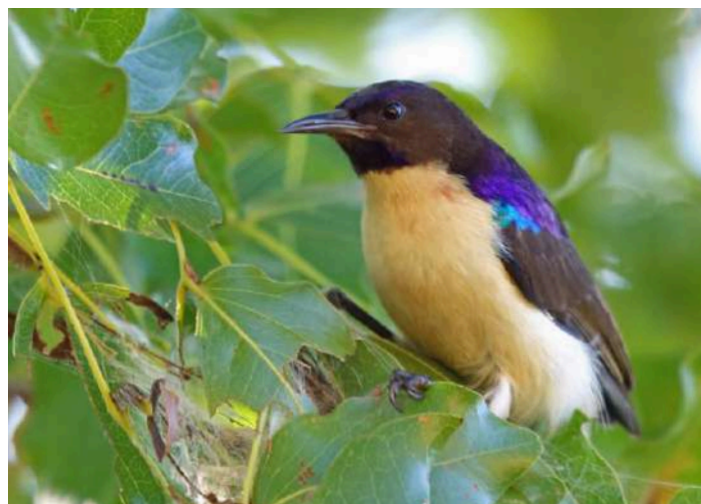
Western Violet-backed Sunbird

10 januari. Heldag i Miomboskogar just utanför Harare där vi letar efter specialiteter för denna miljö, som Miombo Tit, Eastern Miombo Sunbird, Western Violet-backed Sunbird och Wood Pipit. Tillbaka till vår lodge tidig kväll för middag och artgenomgång.