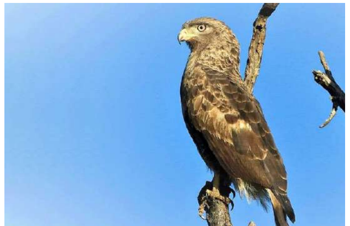
Western Banded Snake Eagle

15 januari. Efter lite morgonskådning en drygt 4 timmars resa norrut till Honde Valley där vi inkvarterar oss på Aberfoyle Lodge. Lite kvällsskådning i fantastisk artrika skogar innan det blir middag på vår lodge.