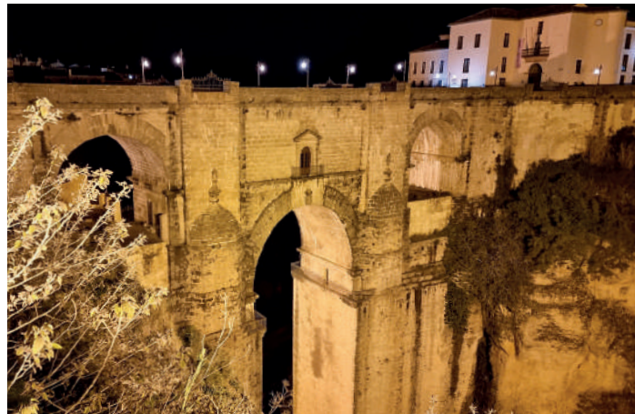
Huvudattraktionen i Ronda är den 100 meter höga stenbron från 1700-talet.

Ett besök i Ronda kräver naturligtvis ett besök vid den vackra ”nya” stenbron, byggd under mitten av 1700-talet och nästan 100 meter hög.