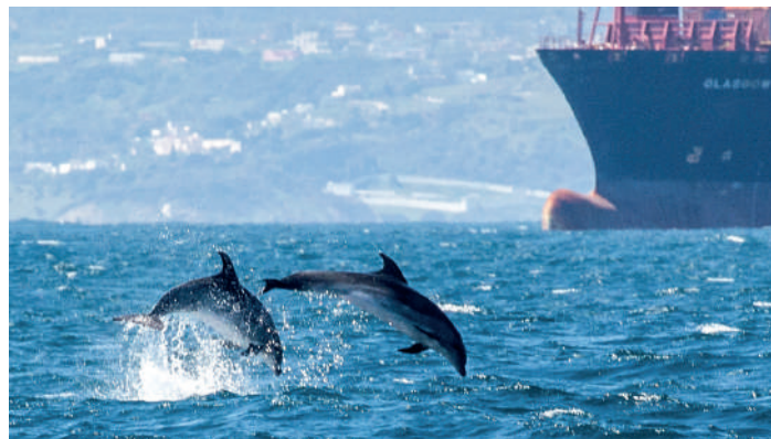
Flasknosdelfiner sågs fint under båtturen i Gibaltarsundet

Innan vi lämnade Tarifas hamn med båt blev vi ombesörda att koppla mobilerna till flygplansläge för att slippa dyra Marockanska räkningar. Det blåste en måttlig västvind. Ute på havet under båtturen var det några som fick smaka på det salta medelhavsvattnet. Det var tunt med havsfågel, endast en ensam havssula kunde observeras. Bättre dock med havsdaggdjuren. Vi fick fina obsar på både grindvalar och flasknosdelfiner.