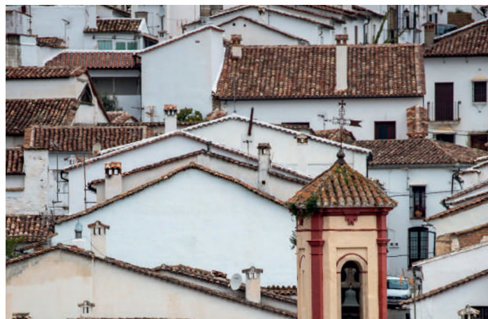
Bergsstaderna Grazalema. Foto: Jim Sundberg.

Direkt efter frukost klarade vi av sevärdheten och fortsatte sedan på vår rundtur i Grazalemabergen. Förmiddagen var lite trög. Ganska kallt i luften och en del regn gjorde att rovfågarna inte var så villiga att visa upp sig. Ändå ganska bra sångaktivitet. Sydnäktergal, kornsparvar och gårdsmysor hördes från bergsslutningarna. Fika intogs i den dramatiskt belägna staden Zahara. Några gåsgamar och alpkråkor med sina kajliknande läten seglade förbi. Strax söder om bergsstaderna Grazalema fick vi utdelning för dagens skådarinsats.