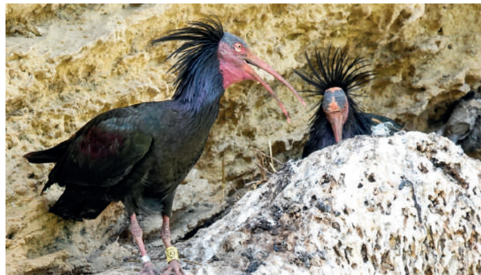
Eremibisar vid Vejer – visst ser de lite oborstade ut?

Dagens huvudnummer var en båttur från Tarifa med mål att se valar, delfiner och havsfåglar. På vägen söderut passade vi på att kolla in kolonin av eremitibis i Vejer. De på klippan häckande fåglarna ser lite ovärdade och tufsiga ut där de samsas med klippduvor i branten.