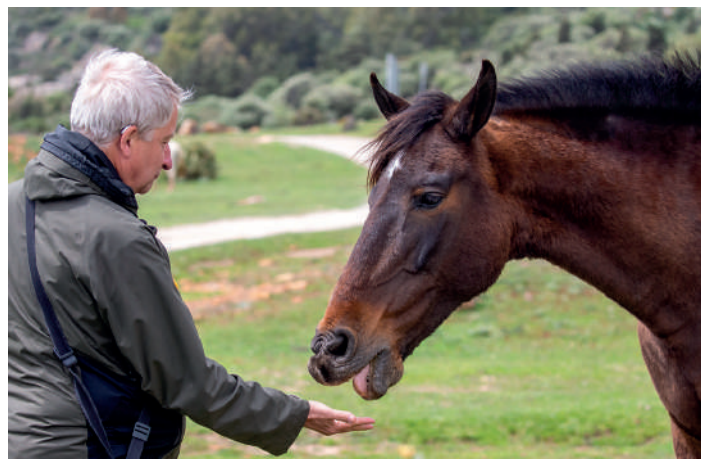
Nyfikna Andalusier fick smaka av våra picnic-morötter.

Vi transporterade oss mot Tarifa på jakt efter sträckande rovfåglar. I den hårda ostliga blåsten blev det något tunt med denna vara, men några dvärgörnar, gåsgamar och bruna glador noterades. Picknicklunchen intogs vid La Pena. Några hästar i hagen var nyfikna och fick smaka lite morötter.