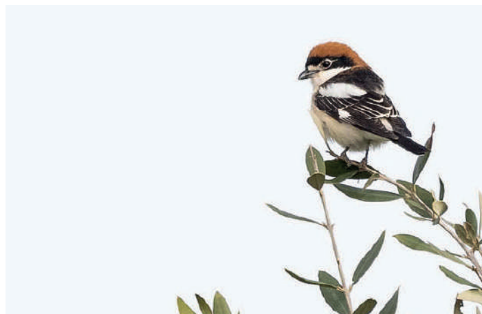
En rödhuvad törnskata visade upp sig fint i en busktopp.

En rejäl frukost på hotellet gav dagen en bra start. Vi passade på att checka av Guadalhorce direkt efter morgonmaten. Lokalen har en mycket bra omsättning av fågel i sträcktid. Vid den stora lagunen fanns förstas för oss nya fåglar. Nästan tillsammans på den lilla ön nära gömslet stod 2 sandtärnor, 2 kentska tärnor, en skäggtärna, svarthuvad mås och skrattmåsar. I detta gäng upptäcktes en ung långnäbbad mås, som stack ut med sin långnästa uppsyn. Runt omkring i buskmarken flöjtade nyanlända sydnäktergalar. På vägen tillbaka till bussen sågs en rödhuvad törnskata mycket fint i en busktopp.