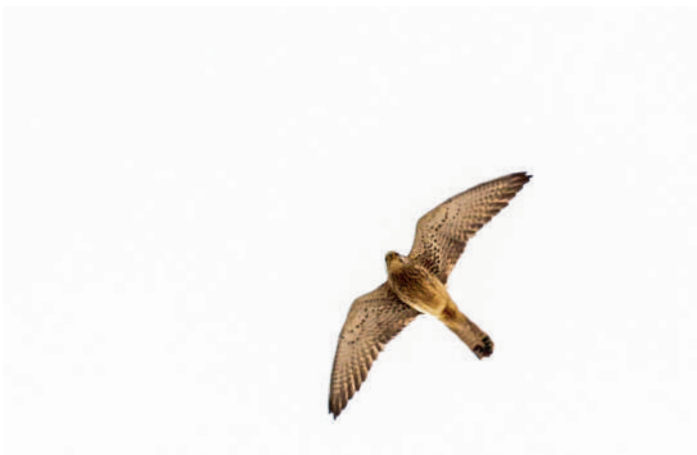
Vid Alcalá de los Gazules sågs runt 20 av de häckande rödfalkarna.

Den hårda blåsten och det lätta regnet gav dåliga utsikter för rovfågelsträck – vi beslöt oss för att köra direkt upp mot bergen. Vid Alcalá de los Gazules tog vi en cafe con leche och kollade in de häckande rödfalkarna.