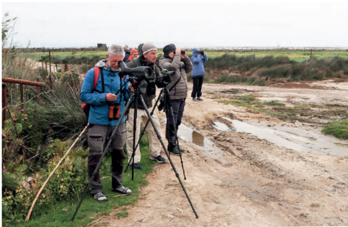
På spaning efter svartbent strandpipare vid Playa de los Lances.

Den hårda blåsten och det lätta regnet gav dåliga utsikter för rovfågelsträck – vi beslöt oss för att köra direkt upp mot bergen. Vid Alcalá de los Gazules tog vi en cafe con leche och kollade in de häckande rödfalkarna.