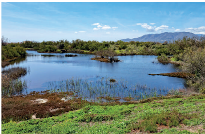
Naturreservatet Guadalhorce.

Hela gänget samlades på café La Manon på Malaga flygplats strax efter 11. Förväntansfulla packade vi in oss i den hyrda Peugeotbussen och tog oss ett par kilometer söderut mot floden Guadalhorces deltaländ. Väl framme stoppade vi i oss picniclunchen bestående av gravlax-mackor och frukt samtidigt som vi noterade de första fågelarterna på resan. Sex, sju biätare passerade på lite håll. Naturreservatet Guadalhorce är välbesökt under helgerna.