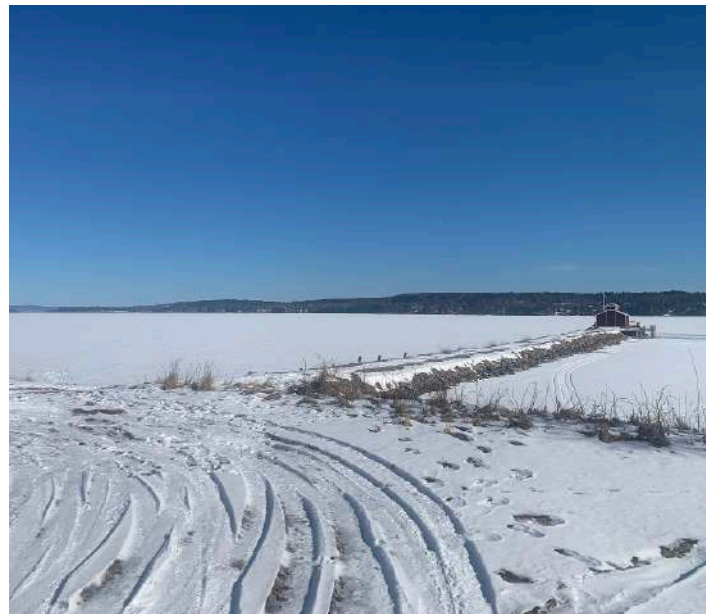
Fornby Långbrygga, Siljan