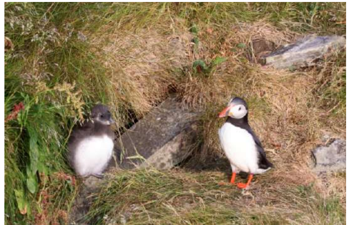
Lunnefågel med unge.

Efter en något tidig middag var det åter dags att gå upp på berget, bort till lunnefåglarna. Upp på myren fick storlabbarna välförtjänt uppskattning och uppe vid Lundeura (= lunneutsiktsplatsen) var lunnefåglarna i farten. Ena partnern kom hem med fisk till ungarna, vilken främst består av tobis, men även t.ex. sill, skarpsill, lodda och mindre torskar. På Runde har populationen ökat under senaste åren till cirka 65000 par. Mäktigt! Lunnefågeln kan dyka ned till 60 meters djup under födosöket och med hjälp av tungan klämma fast många fiskar i näbben, normalt 5-12 cm långa. Lunnefåglarna synkroniserar ungarnas uthopp så att de flesta lämnar bona samma natt och vid dagningen har de hunnit en bra bit ut till havs, allt för att minska riskerna för predation från främst storlabb och havstrut. Ungarna klarar sig därefter direkt på egen hand.