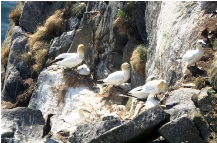
Havssulor med ungar.

Först lunnefåglarna, med enstaka sillgrisslor och tordmular, och därefter havssulorna med sin uppenbara koloni i berget Rundebranden. Däremellan en och annan havsörn och efter det en dockning nära rastande toppskarvar. Ljuvligt! Över havet mängder med havssulor, de flesta adulta eller subadulta, men även enstaka yngre. Havssulorna gör likadant som lunnefåglarna, tillbringar normalt sina första två år till havs och båda arterna når då så långt ned som till nordvästra Afrika (havssulan går även långt in i Medelhavet), för att därefter återvända till kolonin och se hur livet ter sig där innan de skrider till häckning, lunnefågeln vid fem års ålder och havssulan vid 5-6 års ålder.