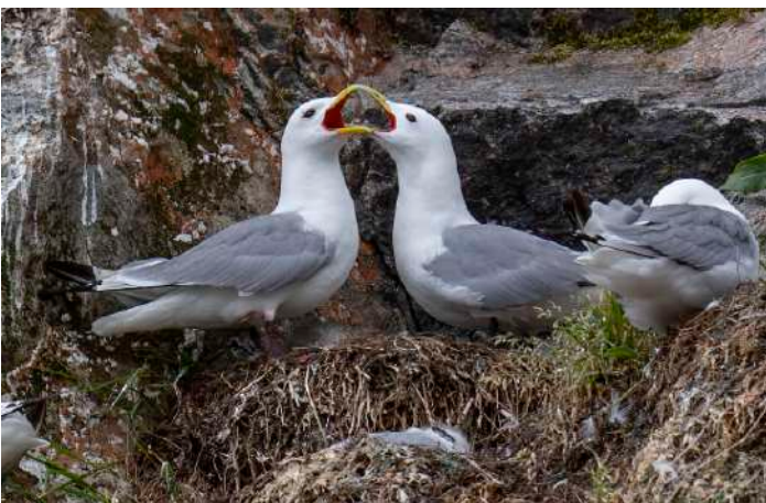
Tretåig mäs.

Ett par tranor med två ungar fick oss att stanna utmed vägen mot Runde och vi noterade med glädje att vägfärjan mellan Sulesund och Hareid var elektrifierad. Väl framme, och efter att vi på ön sett strandskator, gravänder och gråhägrar, de senare storögt betraktade av norrlänningen i gänget, nådde vi snart fram till hotellet. En skärpiplärka sökte föda vid parkeringen och först efter snabb artning kunde vi inkvartera oss. :-)