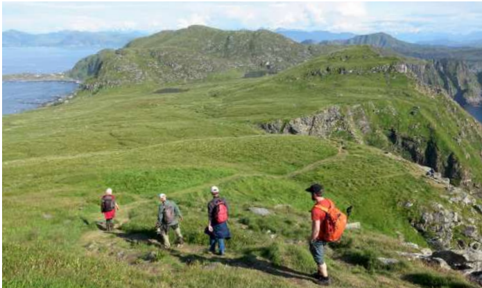
Vandring på norra Runde.