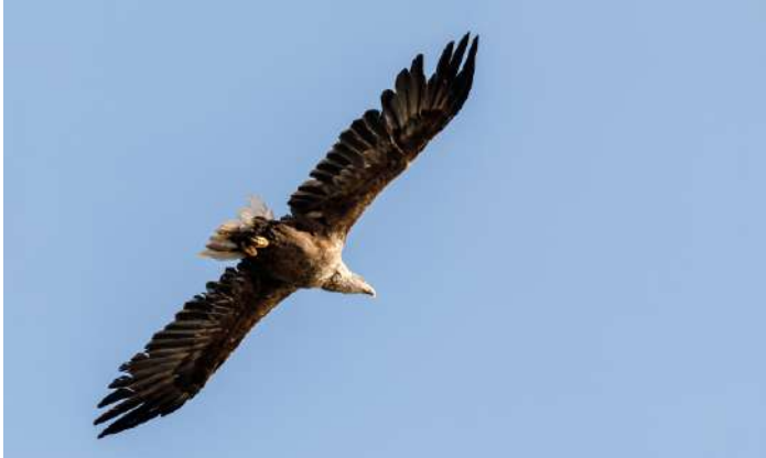
Adult havsörn.