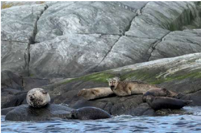
Knobbsälar på Grasøyane.

Väl nere vid hamnen för nästa båttur hade Karin hittat ett par slätterfjärilar, bland de nordligaste som setts i Norge. Så var det dags för båtturen norrut till Grasøyane, för chansen att få se sälar och fler fåglar. Bland silvertärnorna hade vi ett par misstänkta fisktärnor, men hållet var lite för långt. En ny researt fick vi dock snart in, två småskrakehanar i eklipsdräkt (honlik dräkt), vilka reseledaren initialt bestämde till storskrakehonor p.g.a. av utseendet på halsen, vilket liknar storskrake. Där låg även en liten grupp knobbsälar och den misstänkta gråsälen blev även den till slut en knobbsäl. Inte så lätt när bilden i handkikaren inte är tillräckligt stilla.