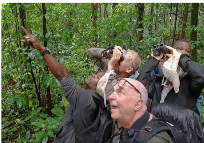
Gruppen får se världens minsta ibis, São Tomé Ibis.