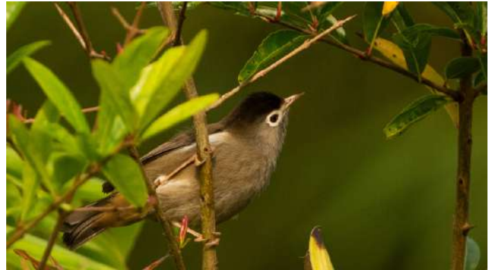
Black-capped Speirops.