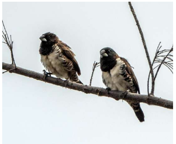
Bronze Mannikin.

Vi hann med lite vila innan det var dags för nästa äventyr – en kvällsexpedition för att försöka få se eller höra Principe Scops Owl. Denna dvärguv upptäcktes så sent som för drygt tio år sedan. Vi startade vandringen vi fyratiden för att nyttja det sista dagsljuset. Vi gick på en gammal igen-vuxen väg som en gång ledde till en nedlagd plantage så underlaget var helt okej. På vägen upp fick vi äntligen se Principe Starling bra. Det var gott om Timneh Parrot som ömsom vislade och ömsom skrånade uppe i trädkronorna. Efter en och en halv timme nådde vi höjdryggen där Laudino brukar ha ugglan. Vi fick vänta ändå tills det blev mörkt innan den första dvärguven började vissla. Sedan kom en annan igång och till slut var de tre stycken av denna kanske världens mest sällsynta ugglor. En i gruppen fick se den flyga och alla andra var mycket nöjda med upplevelsen ändå. Och nere vid bilen fick vi se en African Civet – ett afrikanskt kattdjur. Succé!