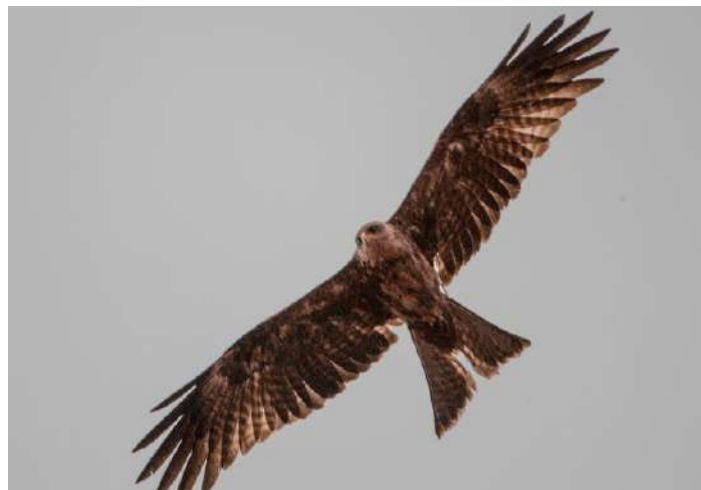
Yellow-billed Kite.

Efter en rätt så krävande promenad uppåt nådde vi en plats där man på tidigare resor övernattat. Vi var tacksamma att slippa det denna gången med tanke på hur lerigt och blött det var på campingplatsen. Under skydd av paraplyer åt vi vårt lunchpaket bestående av morotsris, pumpamos och kyckling.