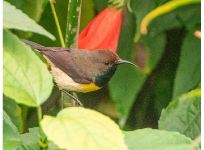
Newton's Sunbird.

Eftermiddagens vandring blev en lugn sådan i hotellets omgivningar. Vi såg de vanliga arterna som African Green Dove och Principe Sunbird.