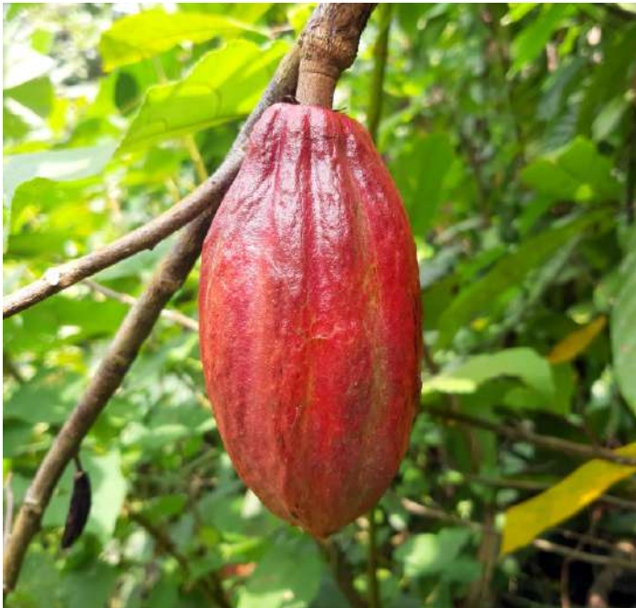
Kakaofrukt.