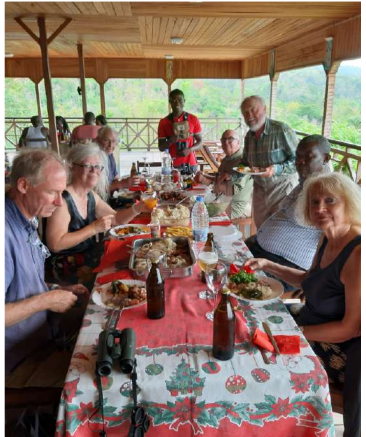
En av de många goda luncherna.

Sedan var det dags att åka till vårt hotell som var det samma som det vi bodde senast på i São Tomé. Newton's Sunbird och São Tomé Paradise Flycatcher hälsade oss välkomna tillbaka.