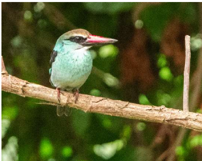
Blue-breasted Kingfisher.

Idag skulle vi försöka se arter som vi missat hitintills. T ex Velvet-mantled Drongo och Principe Starling. Vi tog vägen till hotellet Sundy och efter en stund såg första bilen en drongo sitta högt uppe i ett träd. Tyvärr hann den flyga iväg innan det att alla fick se den. Inte heller några White-eyes gick att finna. Vi fick däremot se Principe Speirops väldigt fint. Och några Bronze Mannikin ville också visa upp sig. Vi for vidare och passerade Principes enda stad, Santo Antonio, där det gick en småspov i hamnen. Laudino kände till ett stort träd som drongon brukar gilla men ingen svart fågel var på plats. Vi fick under förmiddagen se en liten geckoödlå, Annobon Dwarf Gecko och dessutom fick vi ta del av folklivet på ön.