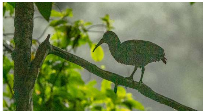
São Tomé Ibis.