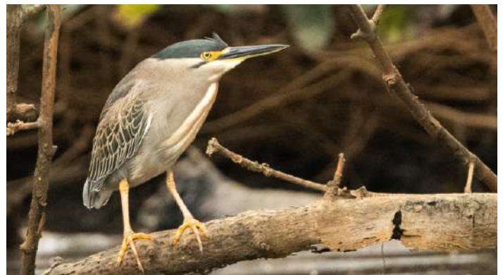
Striated Heron.