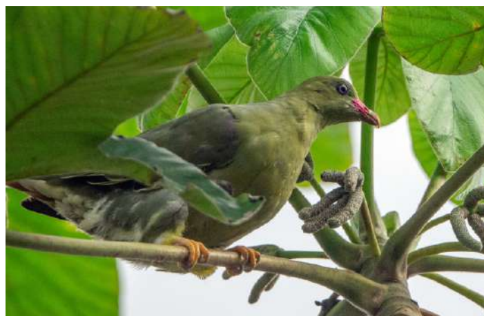
African Green Pigeon.

Vi åt middag på hotellets restaurang som låg rakt över gatan. Det började med en mustig soppa som var den bästa vi fått hitintills. Huvudrätten var ett spett med grillad tonfisk och diverse grönsaker och till efterrätt fick vi kokoskaka med riven choklad ovanpå. Några resenärer beställde vin men när det skulle serveras hittade kyparen ingen korkskruv. Katastrofen avväjdes med att Jan sprang upp till sitt rum och hämtade en Schweizerkniv som bland annat hade en korkskruv.