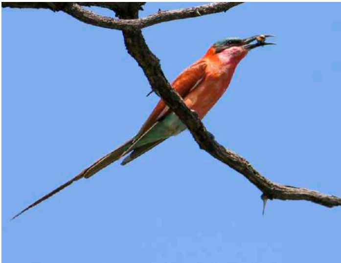
Southern Carmine Bee-eater

19 oktober. Avfärd mot South Luangwa Nationalpark. Längs vägen gör vi flera stopp för att skåda och förhoppningsvis kommer vi bland annat att se Livingstone's Flycatcher. Eftersom det är en långt att köra kommer vi att övernatta efter drygt halva sträckan. Dagens bilresa blir ca 7 timmar. Natt på Guesthouse Katete.