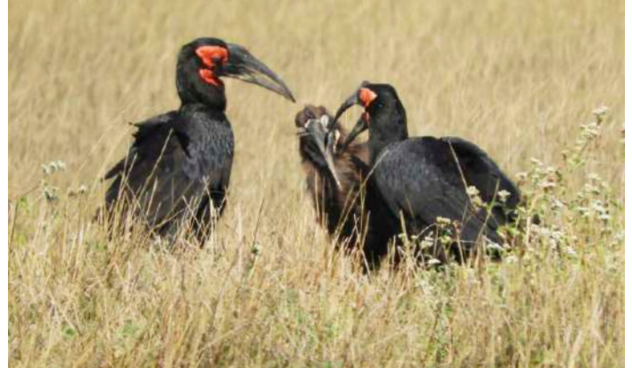
Southern Ground Hornbill

2 november. Skådning och gamedrive vid Chisamba som ligger 10 mil från Lusaka och är klassat som ett IBA (Important Bird Area). Här finns bland annat Zambias enda helt endemiska fågelart – Chaplins Barbet och många rovfåglar. Natt på Fringilla lodge.