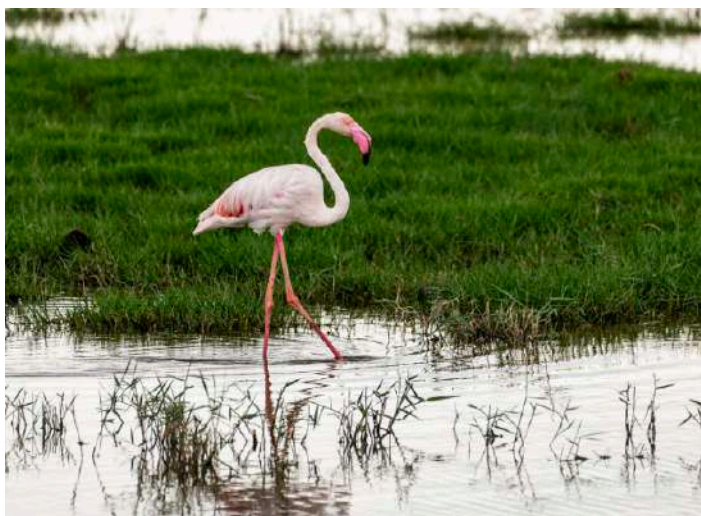
Större flamingo.

I Andalusien fanns eremitibisen troligen fram till 1500-talet och här körs introduktionsprogrammet vidare trots att EU drog in anslagen 2019. Idag finns det ett hundratal fåglar i det vilda i regionen, med ett 25-tal par häckande. En grupp häckar i en stor spricka i en klippvägg vid vägen genom La Barca de Vejer, men det finns inga fåglar där nu. Till skillnad från andra ibisar vadar denna inte i vatten, så den eftersöks på torra land. På lokalen där vi fann dem hittades även tofslärkor och en korttälarka.