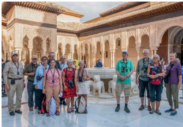
Gruppen i Alhambra

Den första vi möter är en av befästningens 60 katter, vilka guiden har god kontakt med. Från mitten av 1200-talet till slutet av 1300-talet byggdes Alhambra av den kungliga dynastin Nasrid, mer känd som Alhama, men på platsen för den militära avdelningen, Alcazaba, finns omnämnt bebyggelse från flera hundra år tidigare. Här var det spännande att se hur officerarna hade bott i sina trånga bostäder, men ändå med plats för toalett inne. Vi gick upp i ett av tornen för milsvid utsikt över Alhambra och över Granada.