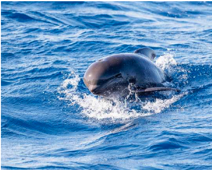
Långfenad grindval.

När vi kört vidare ett tag och styrt båten mot norr igen dök det upp delfiner. De var lite utspridda och vi uppskattade antalet till ett hundratal. Samma taktik, vi stannade båten och efter en stund kom en del av dessa sadeldelfiner bort till vår båt och simmade här av och an en god stund. Delfiner tar sig fram med hög hastighet i vattnet, över 50 km/h, och vi fick även se delfiner hoppa upp ur vattnet i fartfyllda språng, vilket utlösta glada tjut från oss på båten. Under safarin såg vi dessutom tre solitära klumpfiskar nära båten, en väldigt god utdelning.