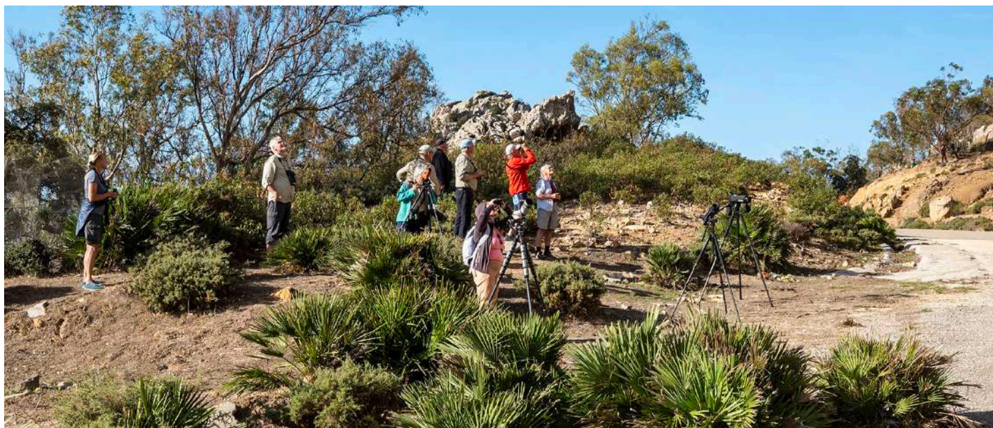
Skådning vid Sierra de la Plata.