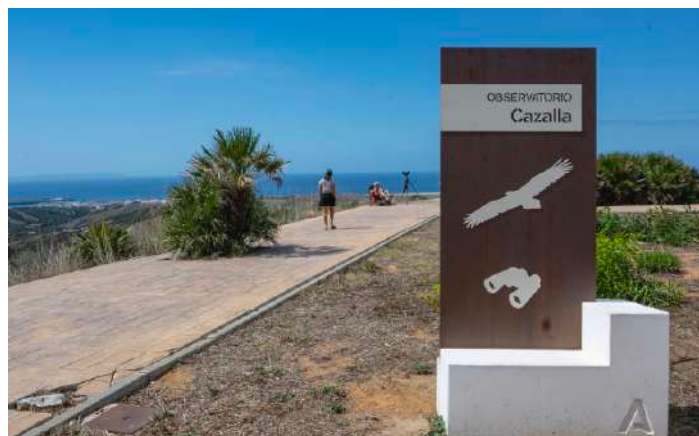
Cazalla Watch Point.

Vi for upp till sträcklokalen Cazalla Watch Point och såg flockar med svart stork glida ut mot Gibraltarsund, en otroligt vacker syn. Här sågs även dvärgörnar, ormörnar och enstaka smutsgamar sträcka mot Afrika. Skruvar med gåsgamar sågs inåt land.