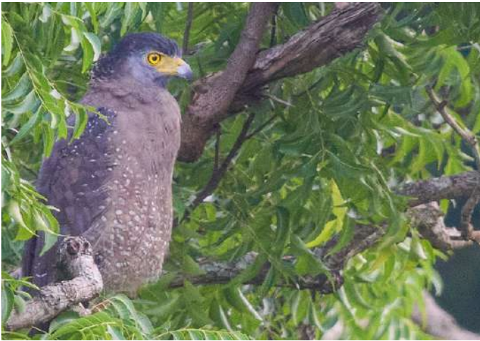
Crested Serpent Eagle

19 februari. Före frukost klättrar vi upp för Sigirya Lion Rock Fortress och skådar. Frukost på hotellet och sedan 165 km körning till Kitulgala och vårt hotell.