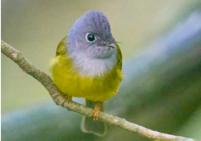
Grey-headed Canary Flycatcher

25 februari. Vi lämnar hotellet tidigt med lunchpaket och besöker nationalparken Bundala, på förmiddagen. Vid lunchtid har vi nått Udawalawe där vi lunchar. På eftermiddagen blir det jeepsafari i Udawalawe National Park. Natt i Udawalawe.