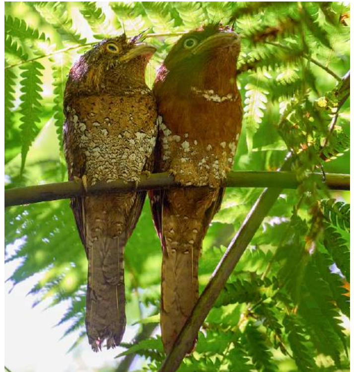
Sri Lanka Frogmouth