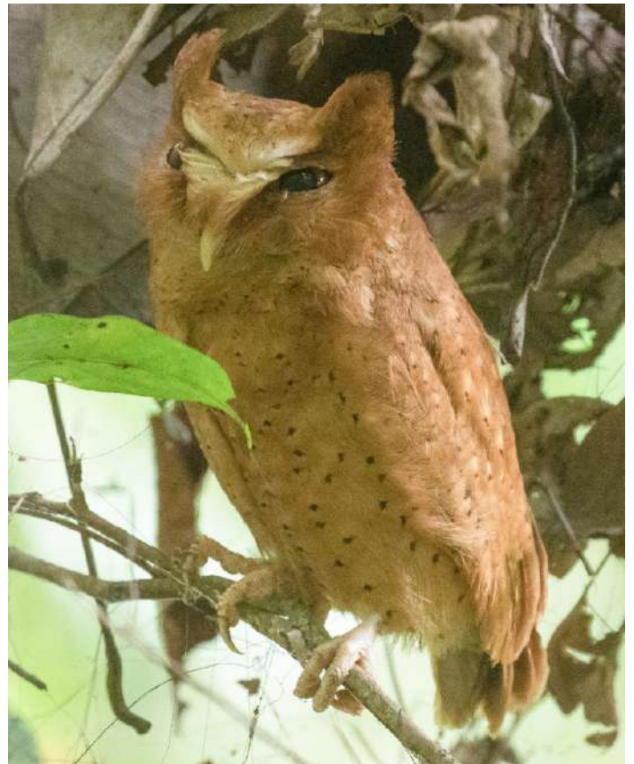
Serendib Scops Owl

23 februari. Efter frukost åker vi mot Tissamaharama (130 km bort) och stannar vid ett naturreservat för att se Brown Wood Owl efter några mil och äter lunch i Ella. Innan vi checkar in på hotellet besöker vi några trädgårdar för flera arter ugglor. Natt i Tissamaharama.