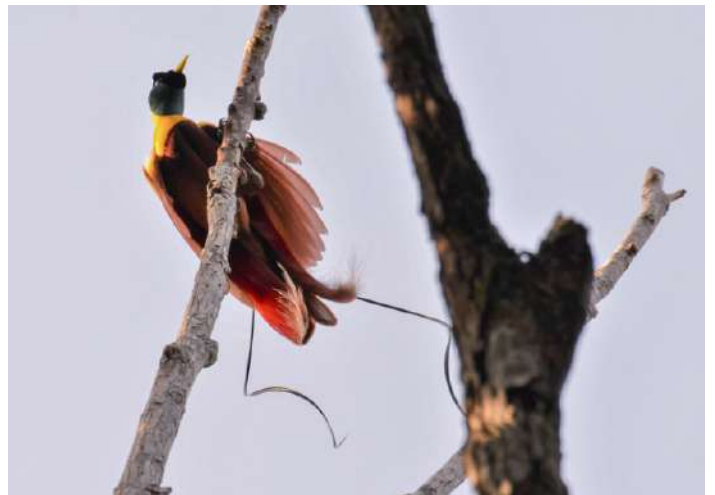
Red Bird of Paradise

23 september. Morgonskådning i Taman Wisata i Sorong, beroende på flygavgångstider för återresa.