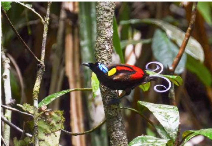
Wilson's Bird of Paradise

16 september. Tidig morgon med cirka 45 minuters körning till en spelplats för Wilson's Bird of Paradise. Här finns förstås mycket andra arter att skåda och vi intar vår medhavda frukost i skogen. Vi äter lunch på en restaurang och efter det skådar vi hela eftermiddagen, eventuellt blir det också lite nattskådning efter middagen.