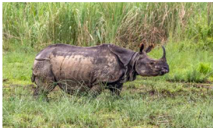
Greater One-horned Rhino

djurliv och en stor mångfald av arter. Här finns skogar och gräsletter och vi kommer att ha chans att se fina däggdjur som tiger, läppbjörn, Greater One-horned Rhino, Gaur Bison, Common Leopard and apor. Över 500 arter av fåglar finns inom parken som dessutom är Nepals allra första nationalpark.