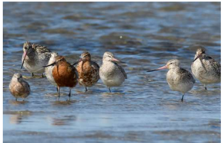
Myrspovar (och en kustnäppa)

Lördag 26 april. Denna morgon kör vi till Simlångsdalen dit vi har med oss frukostpaket. Vi hoppas få se orrspel och har även chans på andra skogshöns, ugglor, hackspettar och korsnäbbar. Därefter åker vi mot kusten för att leta rastande flockar med sjöfågel i Laholmsbukten där vi också äter lunch. Eftermiddagen lägger vi runt Påarp, Larssons våtmark och Trönninge ängar för att titta på simänder, vadare, rovfåglar och hägrar.