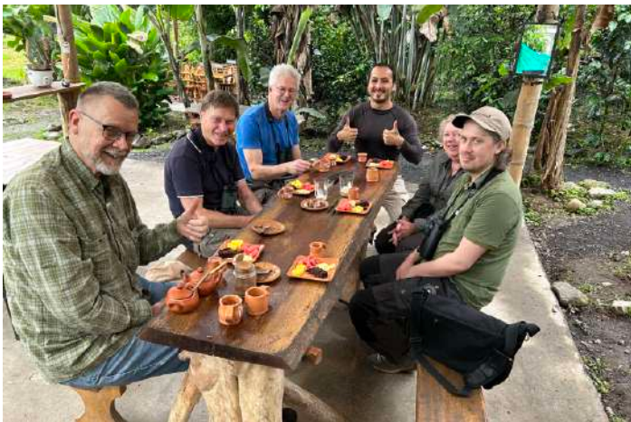
Provsmakning av choklad i Mindo