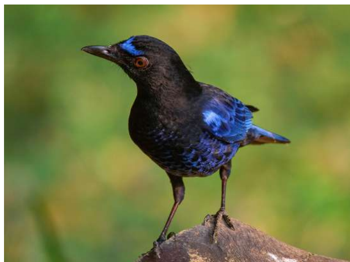
Malabar Whistling Thrush

Fågelsången var intensiv kring hotellet strax innan gryning, inte minst av Malabar Whistling Thrushes "mänskliga" visslingar, och efter frukost tog vi en morgonpromenad vid floden 10 minuter från hotellet och fick se både Palani Laughing Thrush och Indian Scimitar-babbler fint, dessutom såg vi några sibirbeckasiner. Sedan körde vi till Eravikulam-reservatet, som dock var stängt så här års för att inte den endemiska bergsgeten Nilgiri Tahr skulle störas i kalvningen. Vi fick ändå åka en golfbil in till en utsiktspunkt där vi såg Nilgiri Tahr både på mycket nära håll och på lite längre håll. Ett hökörnspår jagade också över klipporna. På kvällen besökte vi ett grannhotells trädgårdar och fick se lite solfåglar och vår första Hanging Parrot innan det var dags för middag.