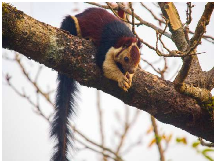
Indian Giant Squirrel

Resdag till Munnar. Men vi började med att besöka Ooty Botanical Garden igen före frukost som nu var folktom och efter hotellfrukosten och utcheckning var vi på väg till Munnar några timmar bort. Vi stannade till vid gränsen till delstaten Tamil Nadu i Chinnar nationalpark för kaffe och lite ap- och fågelskådning. Vi hade där vår enda chans på Grizzled Giant Squirrel, och minsann, fick vi inte se en sådan också! Vi kom fram till vårt fina boende Olive Brook sent på kvällen, mer eller mindre direkt till middagen som till skillnad från tidigare kvällar var av modell al la carte . Annars var det mest bufféer i matväg, och som alltid i Indien var maten riklig på denna resa de flesta kvällar.