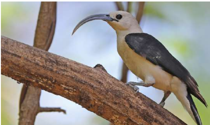
Sickle-billed Vanga.

14 oktober. Båttutflykt ut till Betsibokaflodens mynning på jakt efter Bernier's Teal och Madagascar Sacred Ibis.