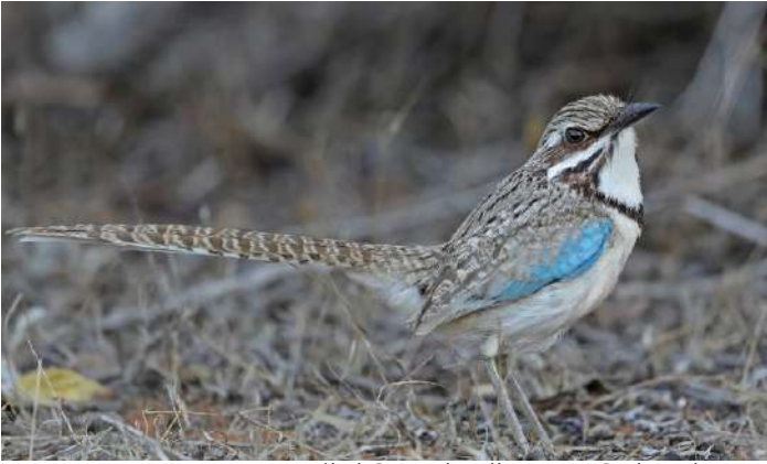
Long-tailed Ground-Roller.

26 oktober. Efter frukost åker vi tillbaka till Tulear med vår snabba båt där vi tar in på hotell. På eftermiddagen besöker vi en lokal utanför Tulear, La Table. Här finns den märkliga "euforbiabushen" där vi hoppas få se Verreaux's Coua och den tämligen nyupptäckta arten Red-shouldered Vanga.