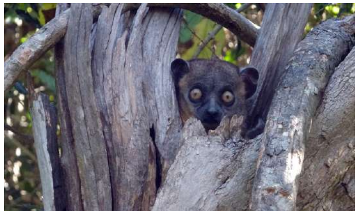
Hubbard's Sportive Lemur

18 oktober. Vi letar oss ut ur Madagaskars huvudstad Antananarivo i våra fyrhjuliga fordon och kör österut. Vägen slingrar sig uppåt för att sedan falla brant ner mot östkustens skogar. Efter några timmar tar vi lunch i reptilparken Pyereras där vi får bekanta oss med olika kameleonter och andra märkliga ödlor. Vi åker vidare mot Perinet, kanske det mest kända reservatet på hela Madagaskar. Väl framme skyndar oss genast ut i skogen och bekantar oss med området fantastiska fåglar och lemurer.