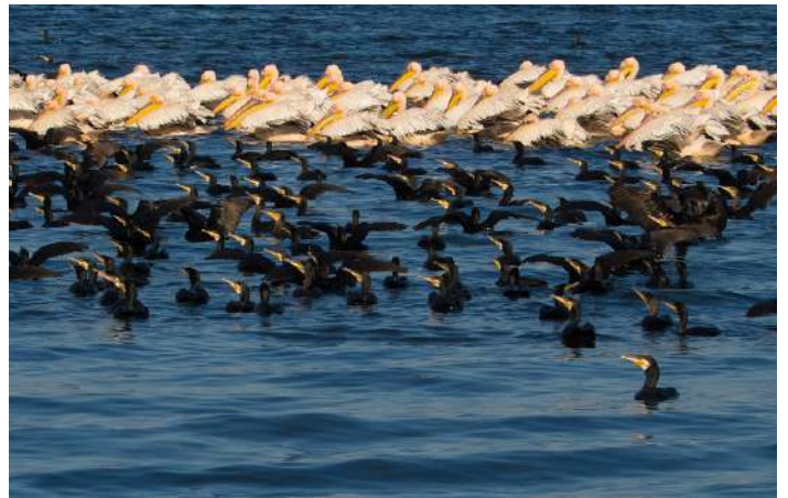
Vita pelikaner och dvärgskarvar

13-17 maj. Donaudeltat. Vi tillbringar dessa dygn på en mycket bekväm hotellbåt i deltat, där vi också intar samtliga måltider. Donaudeltat är ett biosfärreservat och ett av Europas i särklass bästa fågelområden. För att bättre kunna utforska deltats många trånga kanaler och sjöar går vi då och då över i en mindre båt, så att vi kan komma in i smärre kanaler och närmare fåglarna. I deltat finns Europas största koloni av vit pelikan (ca 8 000 ex) och några 100 ex krushuvade pelikaner. Här finns också 60 % av världspopulationen av dvärgskarv! Hägrar av många arter, som rall-, natt-, purpur-, silkes- och ägretthäger är vanliga, liksom kaspisk trut och vitögd dykand. Här och var kan det vara gott om "träsktärnor" – vi har goda chanser på alla tre arterna – skägg- och svarttärna samt vitvingad tärna. Vi besöker också ett par isolerade gamla byar i deltat, där tiden tycks ha stått stilla i många decennier. Byn Caraorman har många storkbon längs "huvudgatan", men här finns även intressanta dammar med vadare och chans på rödvingad vadarsvala och skäggtärna. Nätter på vår flodbåt.