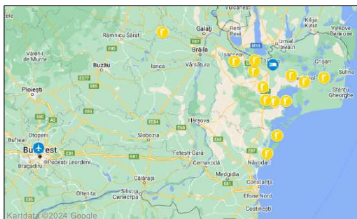
Fågellokaler under resan. Se dag-för-dagprogrammet.

Grekisk-romerska hamnen Histria, borgen i Enisala. Av dägg-djur guldsjakal, vildkatt, utter, vildsvin, sisel, flodiller m.fl.