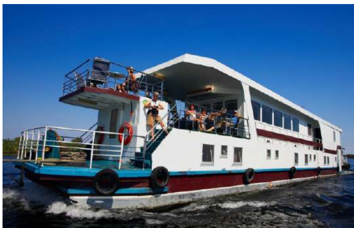
Flodbåten i Donaudeltat