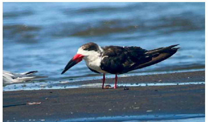
American Skimmer.

Strax före åtta var vi framme vid floden och hoppade på båten som visade sig vara stor och bred vilket gjorde att man kunde röra sig fritt på båten. Och det fanns verkligen mycket att båda titta på och fotografera. Vi såg en ny kungsfiskare, Belted Kingfisher, och en ny vadare, sandlöpare. Vid flodmynningen låg en American Skimmer och vilade.