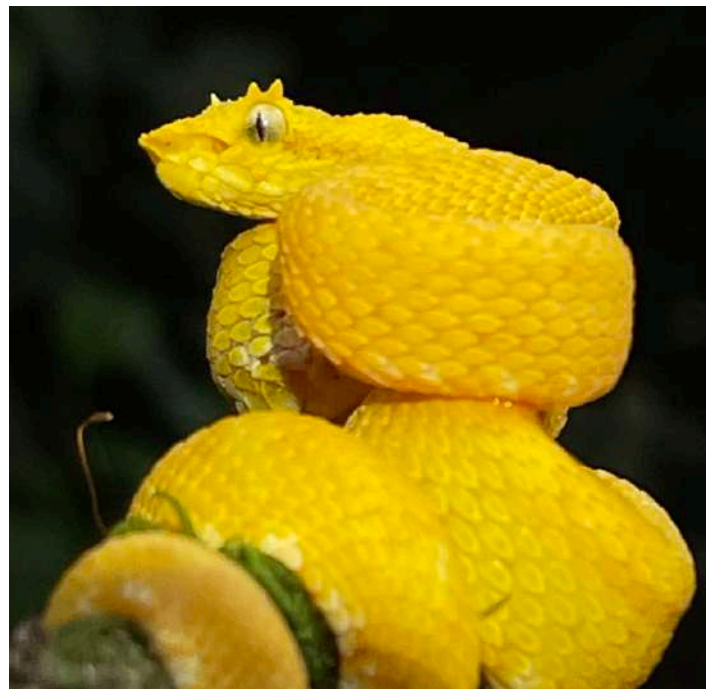
Eyelash Palm Pit Viper.

Efter den sedvanliga artgenomgången hittade vi en stor fågelspindel på gången utanför restaurangen.