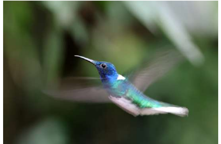
White-necked Jacobin.