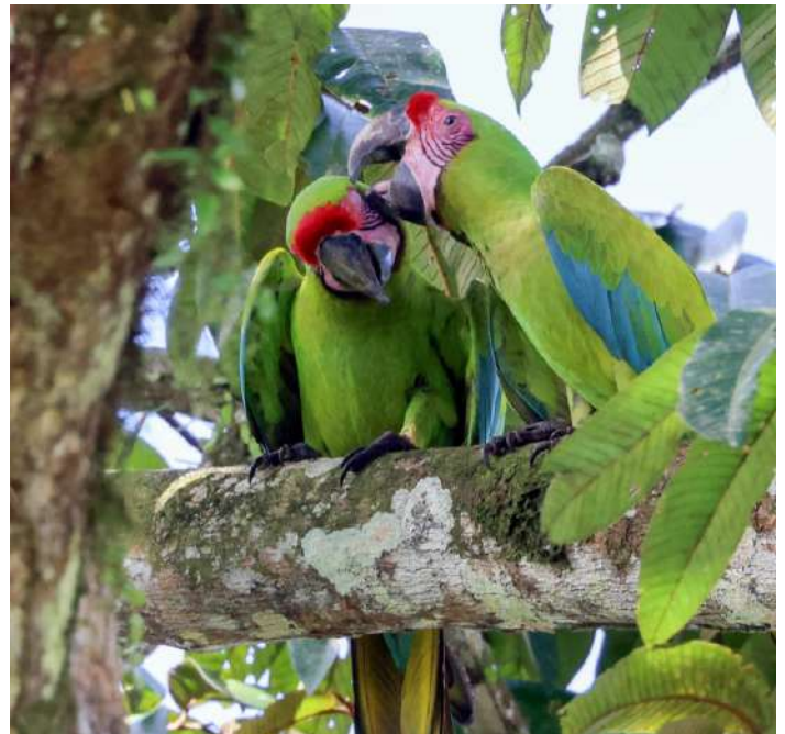
Great Green Macaw.

Efter frukosten åkte vi söderut. Efter någon mil kom en flock Great Green Macaw flygande så vi stannade till. Det visade sig vara ett lyckat stopp då vi fick se minst 20 ex av den stora arapapegojan som en gång var utrotningshotad. Tack vare att man sätter upp holkar så ökar den för varje år. Vi såg även den svärsedda Olive-throated Parakeet.