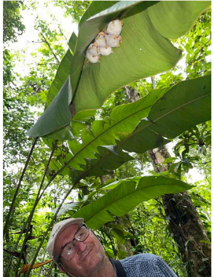
Honduras White Bat

Efter en lunch på stationen och lite shopping i Puerto Viejo åkte vi tillbaka till hotellet för lite siesta. Några passade på att lägga lite mer tid på fotografering. Bland annat fick de