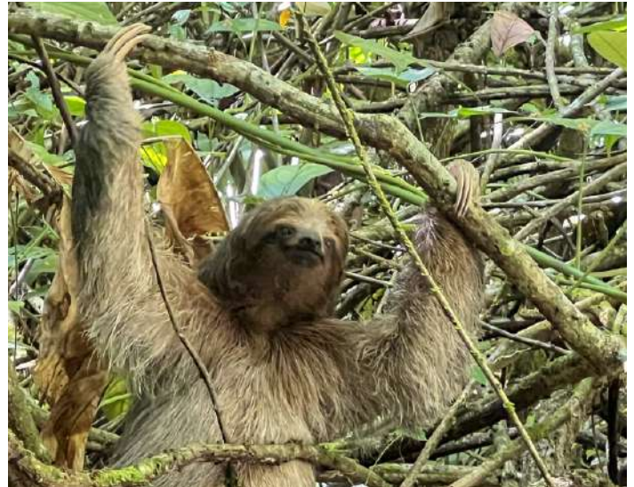
Brown-throated Three-toed Sloth.

Dagen var vikt för ett besök på Arenal Observatory Lodge och dess marker. Efter flera dagar med sol hade vädret förändrats och det kom kraftiga regnskurur emellanåt. Vi började vid lodgens fågelmatare där det som vanligt var