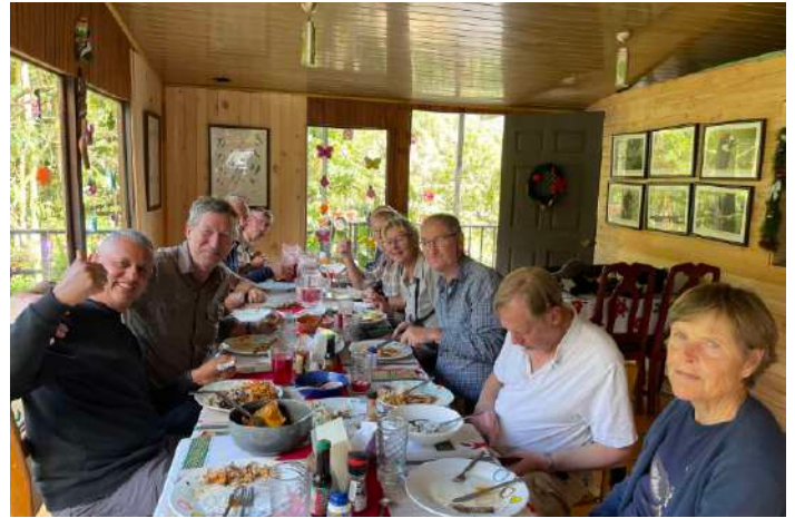
Lunch på Miriams restaurang.

Dagens lunch avnjöts på Miriams lilla restaurang. Där fanns, förutom vår goda mat, både frukt och sockervatten till fåglarna utanför vilket uppskattades av till exempel Acorn Woodpecker, Flame-colored Tanager, Large-footed Finch och Grey-tailed Mountain-gem.