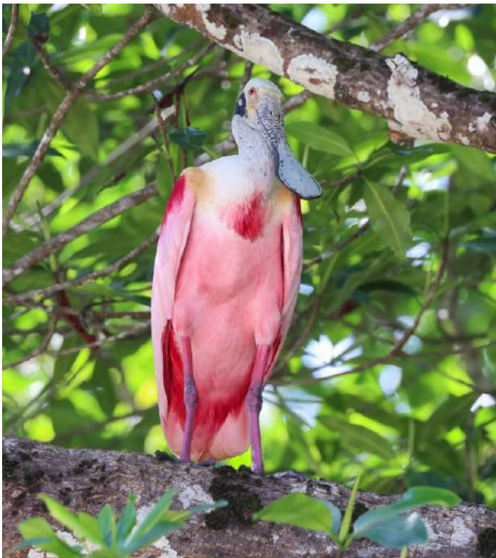
Roseate Spoonbill.

Eftermiddagsturen gick till salinerna igen. Där fanns fortfarande sandsnäppa, tundrasnäppa, amerikansk skogsnäppa, fläckdrillsnäppa, amerikansk småspov och kustpipare. Idag fanns där även sex dvärgsnäppor (Least Sandpiper). Det låg tre saltvattenskrokodiler i den yttre dammen. Några Scissor-tailed Flycatcher flög över oss och i mangroven fanns där även idag Prothonotary Warbler och Mangrove Warbler.