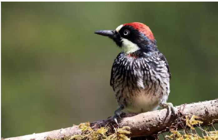
Acorn Woodpecker.

Med ett stort leende på läpparna for vi tillbaka till vår lodge för en underbar frukost. Därefter fortsatte vi någon mil på Panamerican Highway och vek av ned mot San Gerardo de Dota och dalen där. Vi gick en promenad längs ett större vattendrag. Nästan direkt kom ett tåg med fåglar. Det var Flame-throated Warbler, Golden-winged Warbler, Streaked Xenops, Philadelphia och Yellow-winged Vireo. Den sist-nämnda är endemisk för Costa Rica och Panama. Tyvärr är den enligt Herman kraftigt hotad. Under promenaden vidare fick vi se två söta Collared White-start och en Ruddy-capped Nighthingale-trush.