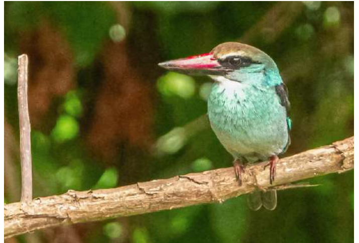
Blue-breasted Kingfisher.