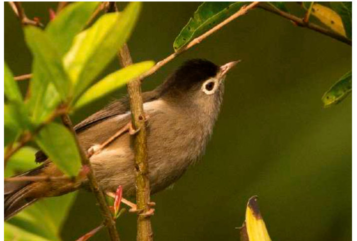
Blue-breasted Kingfisher.