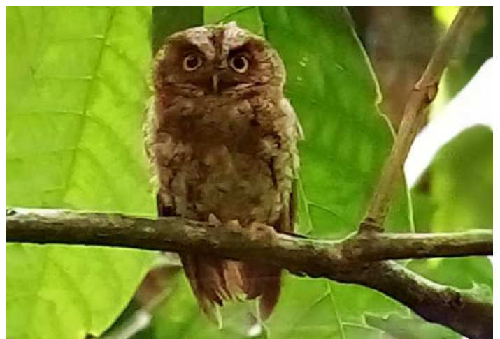
São Tomé Scops Owl