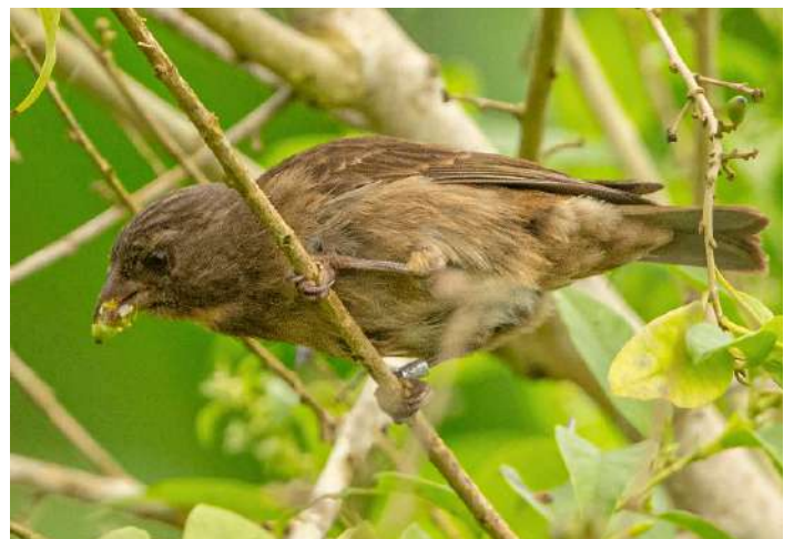
Príncipe Seed-eater.