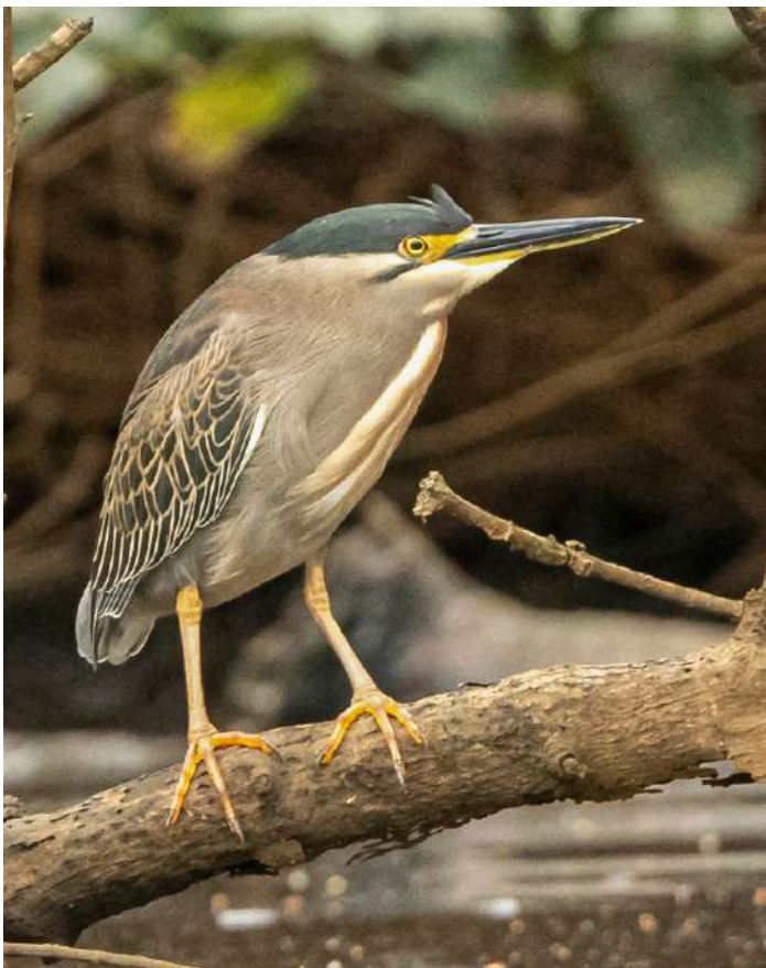
Striated Heron.

10 augusti. Sista dagen på São Tomé där vi lägger upp programmet beroende på vad vi sett tidigare. Vi har sen checkout på hotellen för uppfräschning innan kvällsflyget hem.