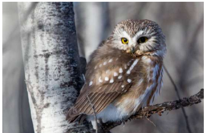
Northern Saw-whet Owl

30 maj. Vi lämnar Pittsburgh men först lite morgonskådning. Eftermiddagen ägnas åt att leta upp Bicknell's Thrush med natt i Colebrook. Men innan vi somnar skall vi lyssna efter Northern Saw-whet Owl.