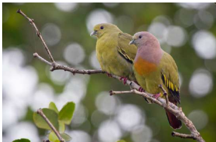
Pink-necked Green Pigeon

23 augusti. Efter frukost skådning vid närbelägna Karaenta forest och eftermiddagen vid Rammang-Rammang River. Här i låglandet på södra delen av ön finner vi delvis en ny fågelfauna. Vi kommer att skåda på stigar i skog men även i mer öppna marker med fiskodlingar och mangrove. Vi hoppas bland annat hitta Pale-headed Munia som är vanligare på södra delen av ön. Natt på hotell i Makassar.