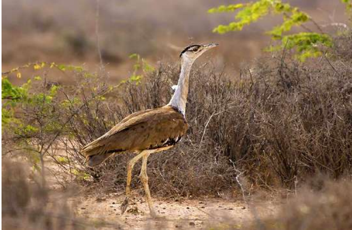
Great Indian Bustard

8 december. Idag transporterar vi oss sex timmar igen, till de torrare, inre delarna av Great Rann of Kutch. Vi gör några stopp längs vägen för skådning och för att sträcka på benen. Natt i Bhuj.