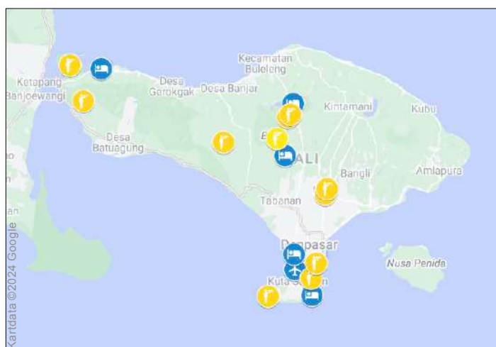
Fågellokaler på Bali. Se dag-för-dagprogrammet.