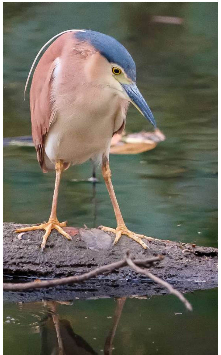
Nankeen Night Heron