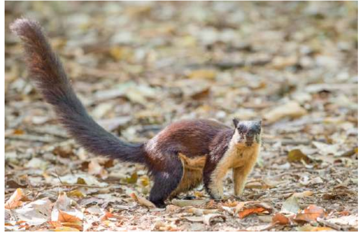
Black giant squirrel