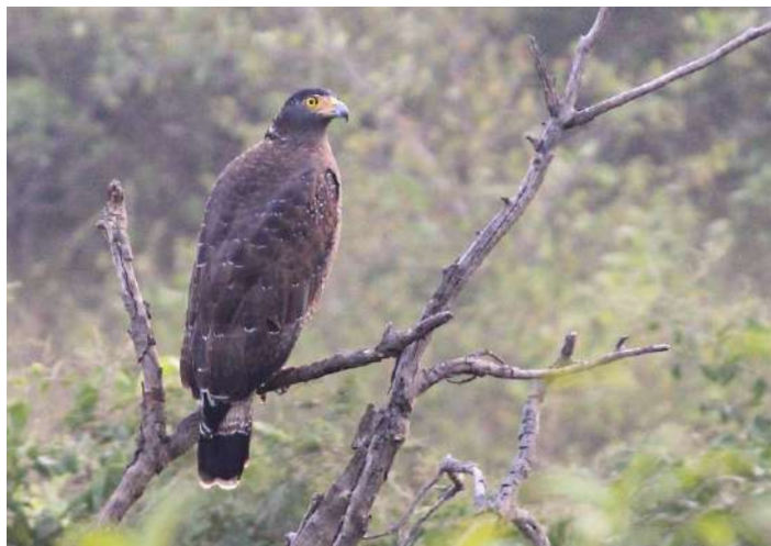
Crested Serpent Eagle

13 januari. Morgonskådning i tempelområdet för det vi inte såg igår. Efter ett besök vid de berömda Jati Luwih risterrasserna beger vi oss lite högre upp i bergen till Bedugul Highlands där nya fåglar väntar.