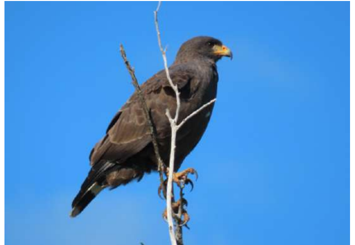
Cuban Black Hawk