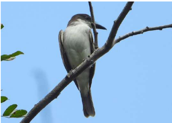
Giant Kingbird.