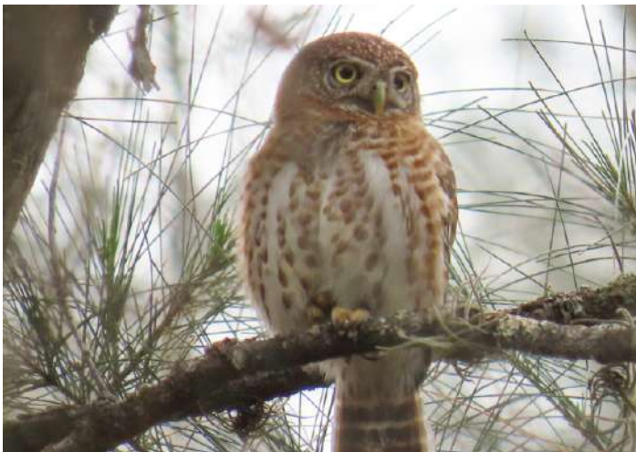
Cuban Pygmy Owl