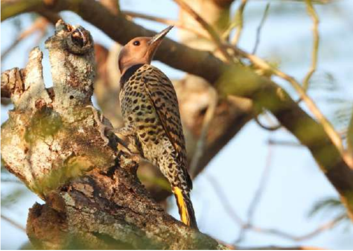
Northern Flicker.