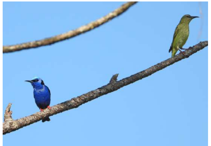
Red-legged Honeycreeper.

Vi avslutade dagen som vanligt med middag och artgenomgång. Fast denna kväll firade vi födelsedag på restaurang med langosta.