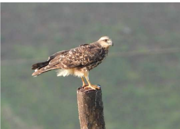
Snail Kite.

Vi åkte mot Havanna efter frukost. Vi stannade till vid havet, vid Marina Hemingway, och njöt av våra mackor och öl i matsäcken. Det var redan eftermiddag när vi åkte mot Las Terrazas. Först stannade vi på en fastighet och såg den endemiska Cuban Grassquit. Sen åkte vi upp till Hotel La Moka, som hyser en fin skog. Här var tanken att leta efter Giant Kingbird och Red-legged Honeycreeper. Inget av det lyckades men vi såg många Loggerhead Kingbird. Vi fick dock plåster på såren senare på eftermiddagen då vi vid en vattensamling kunde se flera Snail Kite som demonstrerade hur man drar ut en mussla ur sitt skal med hjälp av den smala kroknäbben. I skymningen gjorde vi ett besök på en tobaksfarm. Det var intressant att höra om den för Kuba viktiga tobaksodlingen. På kvällen checkade vi in på Ranch San Vicente. Återigen bodde vi i små bekväma privata hus omgivna av skog.