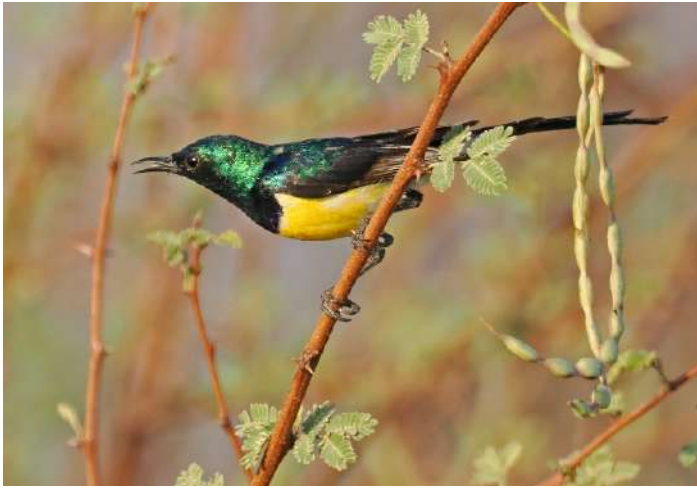
Nile Valley Sunbird

Ett stopp i hettan vid Either Mangroves gav flera fina tibetpipare och lite andra kust- och våtmarksarter samt mangroveformen av rörsångare. Efter lunch och lite vila åkte vi till Al Sadd Lake där ytterligare våtmarksarter sågs men även en White-browed Coucal. Vi inväntade skymningen och i det sista ljuset kunde vi se en spelande Plain Nightjar och fick senare fina obsar även på nubisk nattskärre.