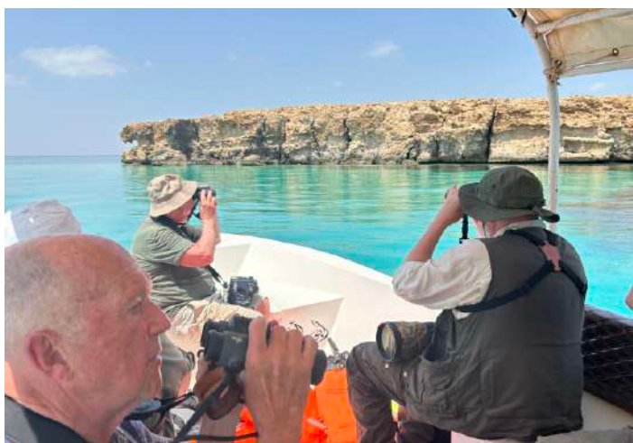
Båttur till Farisanöarna

Vi åkte en kort bit till hamnen och gick ombord på färjan till Farisanöarna 14 km utanför Jizan. Överfarten tog en dryg timme och vi skådade under tiden. Förutom de vanliga tärnorna sågs två rödnäbbade tropikfåglar och en valhaj! Väl på ön blev det lite väntande innan en motorbåt dök upp som vi bordade. Bland de yttre öarna sågs mängder med brunsulor, tygeltärnor och Brown Noddy och det blev fina fototillfällen på dessa. Dagens egentliga målart med turen var sotfalk och det såg vi tre av, som genomförde fin flyguppvisning runt båten. Nöjda med ett par timmar hos sjöfåglarna kom vi iland och blev tagna till gamla stan på Farisan, mest i väntan på att en restaurant skulle öppna. Fisk blev det till middag och den var utmärkt. Under färjefärden tillbaka noterades resans raritet – en rödfotad sula! Endast andra fyndet i Röda havet!