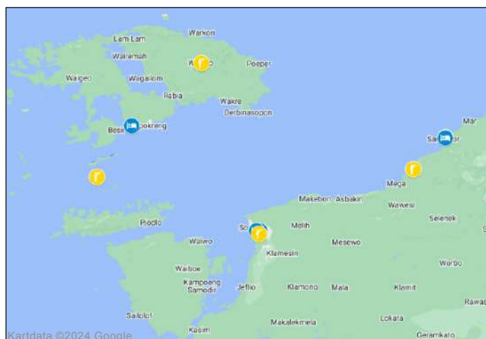
Fågellokalerna under resan. Se dag-för-dagprogrammet.

Vattnen kring Raja Ampat anses som bland världens bästa för dykning/snorkling.