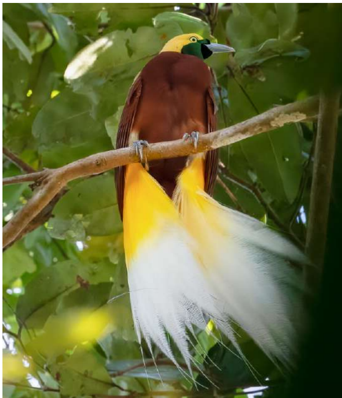
Lesser Bird of Paradise

17 augusti. Morgonskådning i Klasow valley. Efter lunch återvänder vi till Sorong.