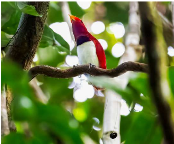
King Bird of Paradise

11 augusti. Tidig morgon med cirka 45 minuters körning till en spelplats för Wilson's Bird of Paradise. Här finns förstås mycket andra arter att skåda och vi intar vår medhavda frukost i skogen. Vi äter lunch på en restaurang och efter det skådar vi hela eftermiddagen, eventuellt blir det också lite nattskådning efter middagen.