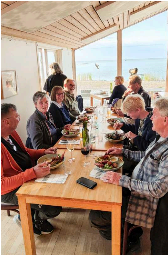
Middag på Stora Karlsö