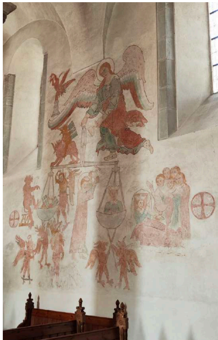
Vamlingbo kyrka med väggmålningar från 1200-talet

I den lummiga byn Vamlingbo hittar vi lite skydd mot vinden. Kikarobservationer byts för en stund ut mot inramade observationer på Lars Johansson museum i den gamla prästgården. Vi tittar också in i medeltidskyrkan på andra sidan gårdsplanen, där en av Gotlands största och mest välbevarade väggmalerier finns kvar från 1200-talet. På eftermiddagen skådar vi längs östra kusten där det åtminstone teoretiskt borde vara lite lä från västvinden.