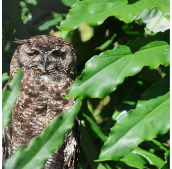
Spotted Eagle Owl