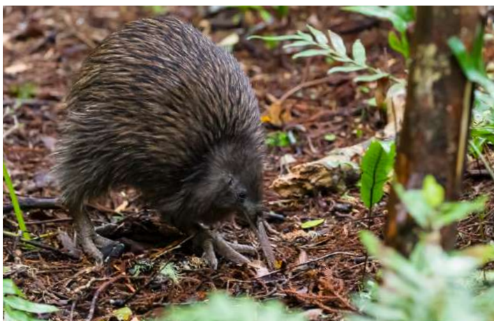
Southern Brown Kiwi

11 november. Efter frukost kör vi till Bluff varifrån vi tar färjan över till New Zeelands sydligaste "fastlands-ö", Stewart Island (Rakiura), där vi skall bo de två kommande nätterna. Under överfarten passar vi på att skåda havsfåglar. Här finns chans på exklusiva arter som Southern Royal, White-capped, och Salvin's Albatross, Mottled Petrel, Common Diving Petrel, Fairy Prion, grålira och Brown Skua – men vindarna bestämmer förutsättningarna. Vi bör under alla omständigheter se fåra första Foveaux Shag under överfarten. När vi anländer checkar vi in på det hotell vid vilket reseledaren under förra resan hit återfann nattfjärilen Frosted Phoenix, som då hade varit försvunnen i 65 år! Kort efter incheckning ger vi oss av till närliggande Ulva Island med en liten båt. Detta är ännu en predatorfri ö och hemvist för några av Sydöns specialiteter som vi troligen inte sett fram till nu, som Yellowhead, Weka (av den lokala minsta rasen) och South Island Saddleback, men även de lite mera vanliga skogsarterna Yellow-crowned och Red-crowned Parakeet, Rifleman och Brown Creeper. Tillbaka i Oban äter vi middag på hotellet. Sedan väntar en av resans höjdpunkter när vi skall ut och leta efter Southern Brown Kiwi i mörkret. Natt i Oban.