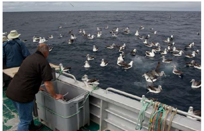
Albatrosser vid "chumming" från båten

6 november. Idag väntar en av världens bästa havsfågel-turer (om vädret tillåter). På förmiddagen gör vi en 3-4 timmar lång båtutture ute vid kontinentalsockeln som börjar några kilometer ut från Kaikoura. Det finns chans på fem arter albatross: New Zealand Wandering (Gibson's), Northern and Southern Royal, Salvin's och White-capped Albatross. Dessutom Northern Giant Petrel, Cape Petrel, Westland och White-chinned Petrel, den mycket lokalt förekommande Hutton's Shearwater, grålira, Short-tailed Shearwater, Fairy Prion och flera andra havsfågelarter. De flesta fåglarna kommer ända fram till båten när skepparen slänger ut sitt "chum". Efter en god lunch i hamn är det återigen dags för en båtutture ut till havsfåglarna. Vi hoppas även få se Dusky Dolphin och valar, t ex kaskelott. Den som istället vill ta det lugnt kan på egen hand ta en promenad längs kusten. Natt i Kaikoura. Sedan väntar en av resans höjdpunkter när vi skall ut och leta efter Southern Brown Kiwi i mörkret. Natt i Oban.