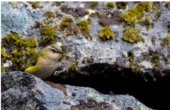
New Zealand Rock Wren

7 november. Detta blir en kontrasternas dag! Vi lämnar boendet tidigt och kör söderut mot sydöns största stad, Christchurch. Strax norr om ligger Ashley Estuary där vi har chans att se lite nya arter, däribland knölsvan, och med en stor portion tur den sällsynta Black Stilt, som vi gör senare försök på också. Resan viker sedan av inåt land och vi kommer få nya chanser på Black Tern, Wrybill och Black-billed Gull längs vägen. När vi närmar oss bergen möter vi skogar där vi eftersöker arter som South Island Robin, Rifleman, Brown Creeper, Yellow-crowned Parakeet och Tomtit. Till slut når vi den alpina terrängen i Arthur's Pass, hemvist för papegojan kea. Vi checkar in på vårt boende inte alltför långt bort. På kvällen gör vi ett försök att åtminstone få höra Great Spotted Kiwi.