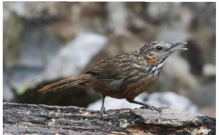
Rufous Limestone Babbler

31 januari. Efter frukost checkar vi ut och rullar mot Bueng Borraphet, Thailands största insjö. Resan dit tar ca sex timmar, och längs vägen stannar vi vid Wat Phra Phuttabat Noi för att se endemen Rufous Limestone Babbler, om vi inte har fått se den tidigare. Natt på Tamsabai Hotel.