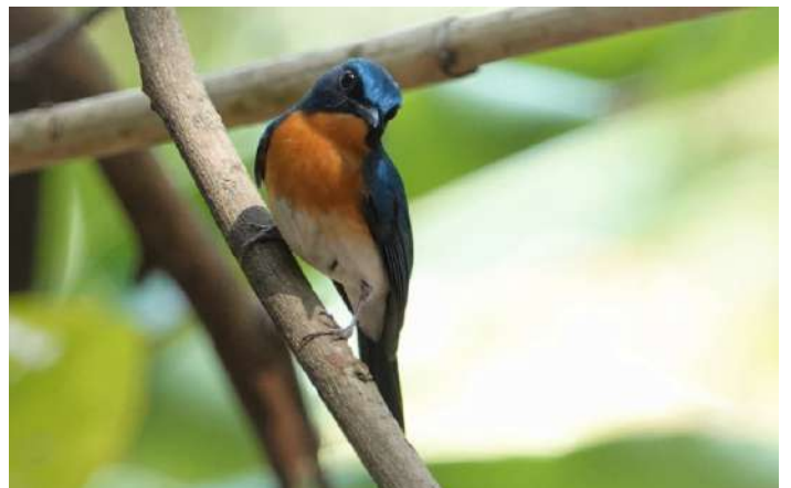
Indo-Chinese Blue Flycatcher

26 januari. Vi åker till Sakaerat Environment Research Station, en forskningsstation med fina omgivelningar, där vi tillbringar hela dagen för att se bland annat Siamese Fireback, Rufous Treepie, Burmese Shrike och kanske också Limestone Babbler. Natt på Suchada Garden.