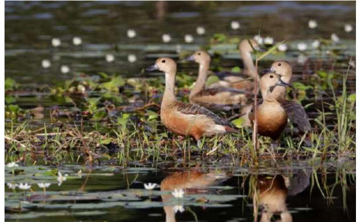
Lesser Whistling Duck

30 januari. Vi ägnar hela dagen åt områdena vid Chorakae Mak- och Huai Talat Reservoir. I december sjuder sjöarna av liv, Lesser Whistling Duck, Cotton Pygmy Goose, African Comb Duck och Garganey kan ofta ses här. När skymningen närmar sig flyger tusentals egretter "hem" till området för natten. Natt på Eireann Boutique Hotel.