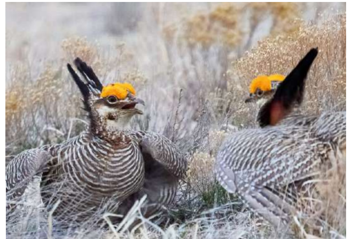
Lesser Prairie Chicken

14 april. Tidig avfärd till spelplatsen för Greater Prairie Chicken. Därefter besöker vi Pawnee National Grasslands och hoppas få se McCown's och Chestnut-collared Longspurs och kanske också ännu en chans på den ovanliga Mountain Plover och kanske gaffelantilop. På eftermiddagen kör vi tillbaka till Denver och samma hotell som vi bodde på första natten.