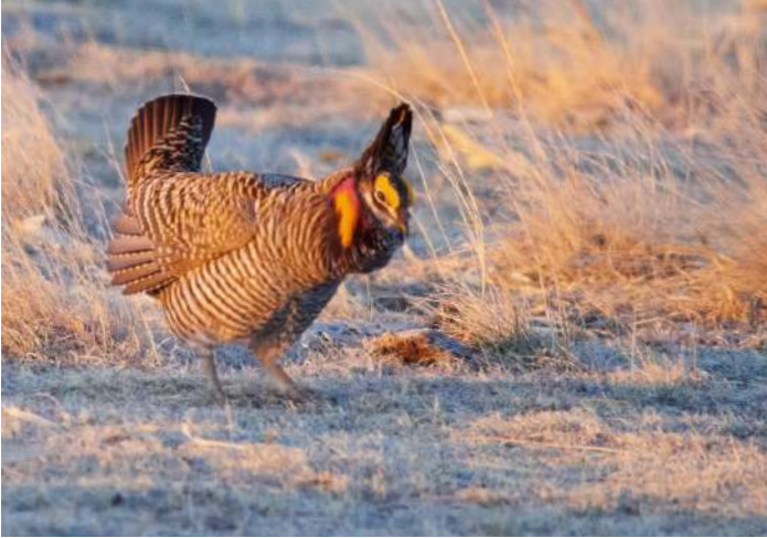
Greater Prairie Chicken