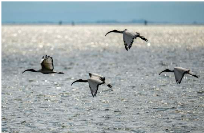
Helig ibis.

Vi avslutade dagen med att besöka buskmarker och en liten skog nära karstsjön Lago di Dobrago. Tyvärr blåste det mycket så det var svårt att höra fåglarna men vi såg flera fina fjärilar bland annat sydlig tryfjäril och almsnabbvinge. Vi hittade även resans första orkidé – en nära släkting till salesprot.