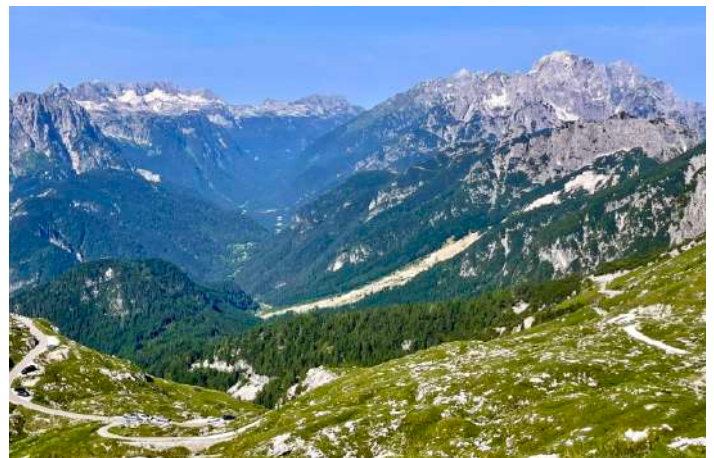
Utsikt från Mangart.

På vägen ned mötte vi många cyklister som kämpade för att nå toppen. För övrigt gick nedfärden bra och eftersom vi hade gott om tid tog vi en sightseeingsrunda i Slovenien. Vi åt lunch i den lilla staden Bovec och fick även se den kända alpina orten Kranjska Gora innan vi kom tillbaka till vårt hotell i Tarvisio. På kvällen blev det en liten avskedsmiddag som avrundades med en mycket smakfull Tiramisu.