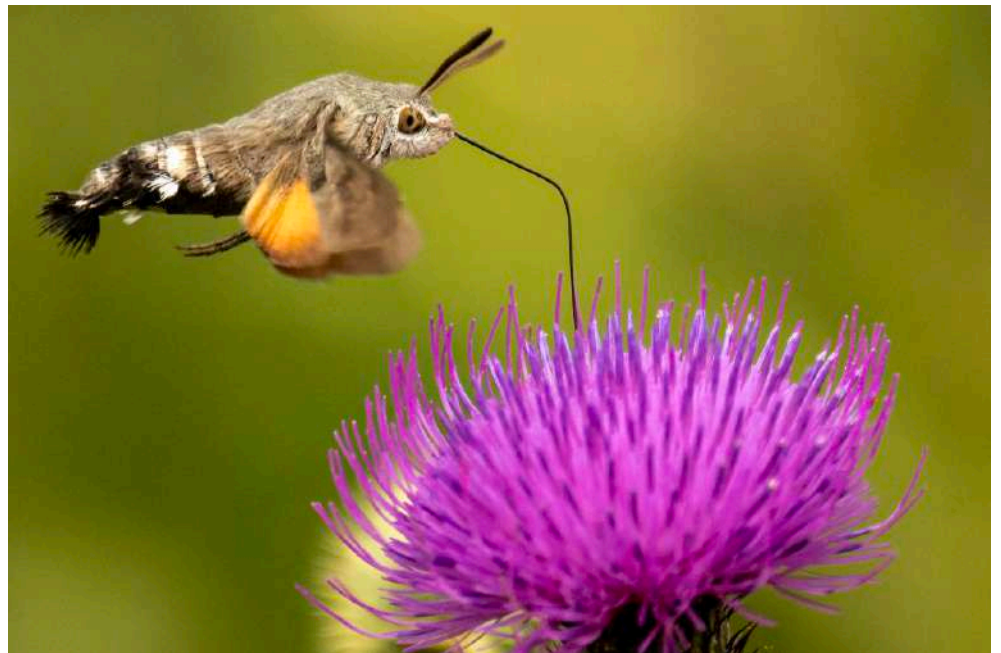
Större dagsvärmare.