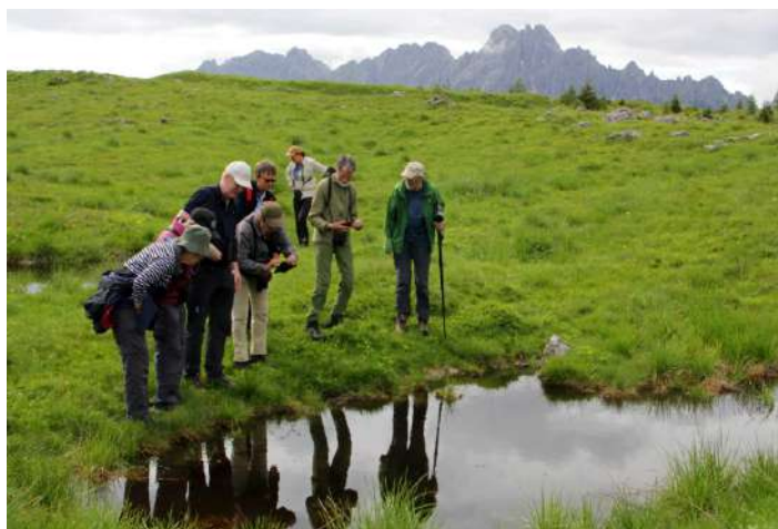
Gruppen hittar bergvattensalamander.

Framåt halvtretiden var det dags att åka upp i bergen. Det blev många serpentiner och tunnlar innan vi nådde bergsbyn Sauris där vårt hotell låg. Eftersom vädret var fint åkte vi på en eftermiddagstur till en alpäng på över 1800 m ö h. Ängen var fylld av blommor i alla dess färger. Det var rosa rhododendron, blå gentiana, gul bergsnejlikrot och vita fjällsippor. På ängen fanns även vattenpiplärka och ringtrast. I ett par dammar simmade bergvattensalamander omkring till Magnus (och oss andras) glädje.