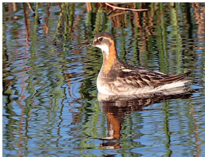
Smalnäbbad simsnäppa.

Frukosten på Klimpfjällsgården var utsökt och laddade med medhavd lunch från hotellet begav vi oss söderut mot Stekenjokk. Första stopp blev gruvsjön där vi tillbringade några timmar och tog kortare promenader i omgivningen. Fåglarna på och runt kalfjället är ofta oblyga, men kräver samtidigt tid att hitta. Därför är det vanligen möda väl värd att ge en lokal lång tid. Således hade vi efter några timmars skådande när sjön fått fina observationer av mosnäppa, ljungpipare, fjällripa och överflygande fjällabbar!