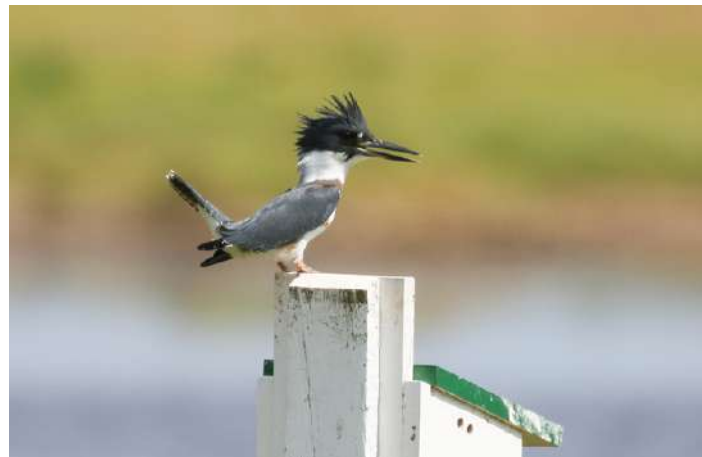
Belted Kingfisher.

Vi börjar bli vana vid frukost klockan 6 och idag körde vi iväg till Kouchibouguac NP. Här finns en fin strand med Piping Plovers häckande, och vi började med att gå ut på stranden innan massorna med badgäster skulle komma. Många fisktärnor fiskade, och vi såg de vanliga småvadarna i relativt små antal men tyvärr inga Piping Plovers. Det är på gränsen att de hunnit ge sig av så här års, men någon brukar kunna vara kvar ett tag. Men tyvärr icke denna dag. På vägen tillbaka tittade vi på några fina vitgumpsnäppor på närhåll, och en mindre beckasinsnäppa sågs också, på lite håll. Nationalparken är stor och omfattar även skog, varför vi tillbringade resten av förmiddagen i skogen och på en myr. Resans tredje American Kestrel sågs, liksom flera Palm Warblers ute på myren. Dessutom fick vi närkontakt