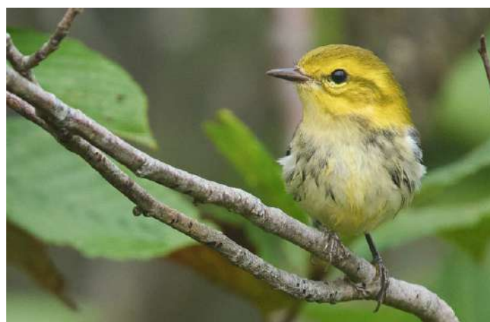
Black-throated Green Warbler

Efter frukost denna dag skådade vi skogssångare i och kring Bouctouche genom stopp på några väl valda platser under förmiddagen. Vi hade fina skogssångarupplevelser och fick in både Black-throated Blue Warbler (några av oss) och Cape May Warbler som nya arter, så nu var vi uppe i 16 skogssångarter. Red Cardinal sågs också bra så att alla fick se den och vi hade tid att även se Bluejays på nära håll, en art vi mest hört och sett flygande förut. Lunchen intogs vid Salisbury, i en lekpark intill en våtmark. Vi gick en runda runt dammen intill och fick snabbt in en väldigt ung Sora tack vare Annas skarpa blick, sedan en till och därefter en adult. Virginia Rail fick vi också se, men största överraskningen var nog en amerikansk rördrom som flög över dammen och som vi en stund senare kunde avnjuta i vegetationskanten. Därefter återfärd till St John där vi gjorde ett stopp vid "Reversing Falls" där tidvattnet pressas kilometervis in i en flod vid högt tidvatten, och rusar ut från floden i havet vid lågt. På väg hem från restaurangen på kvällen lyckades vi få in ännu en art vi hittills missat, gråsparv.