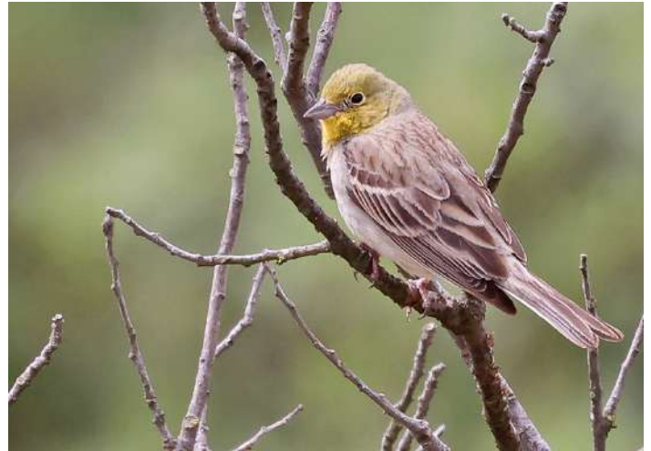
Gulgrå sparv.

Lördag 27 april. Tsiknias-floden öst, Kalloni saliner öst, Napi-dalen och området söder om Mandamados, samt Metochi-sjön.