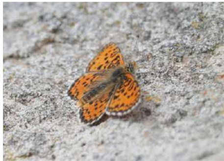
Violettt pärlemorfjäril Boloria dia