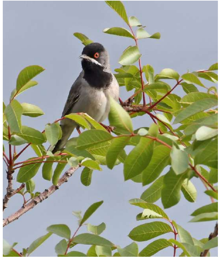
Svarthakad sångare.