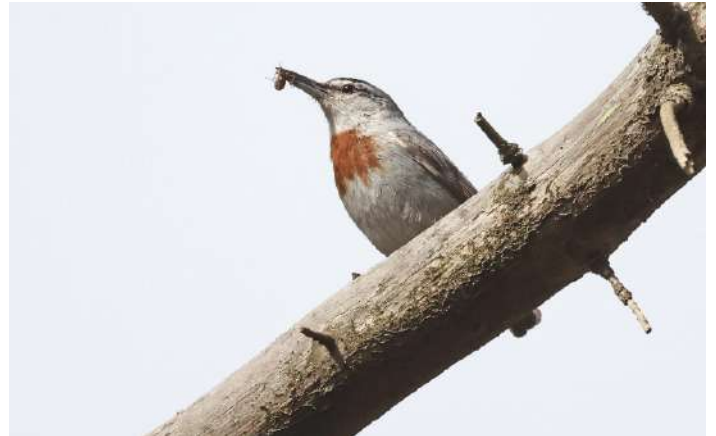
Krupers nötväcka.

Christouflodens delta, endast 10 minuters promenad från hotellet, besöktes före frukosten, denna morgon. Deltat är mycket flackt och brett och fint för fågel. Här fanns ett femtiotal större flamingos, styllöpare och skärfläckor, svartbent strandpipare och en kustpipare, ett åttiotal småsnäppor och några grönbenor. Ett par aftenfalkar drog förbi. Det var en fin morgon! Efter en stärkande frukost embarkerade vi minibussen för ett besök på andra sidan bukten, i Achladeri-skogen, dominerad av turkisk tall och omtyckt av Krupers nötväcka. Arten har för övrigt sin enda europeiska förekomst på Lesbos. Efter en stund hördes nötväckans lockläte och strax därefter upptäckte vi boträdet, en avbruten högtall, där matning pågick av de båda föräldrafåglarna. Det blev fina obsar av denna lilla nötväcka!