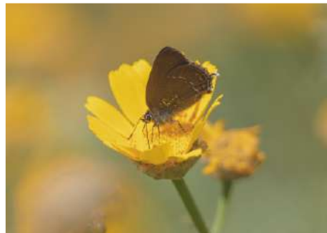
Krattsnabbvinge Satyrium ilicis