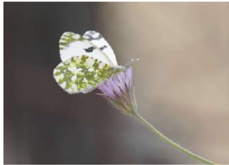
Svartkantad vitfjäril Euchloe ausonia