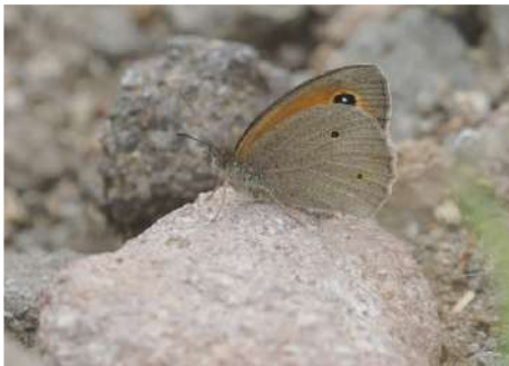
Aegean Meadow Brown Maniola telmessia