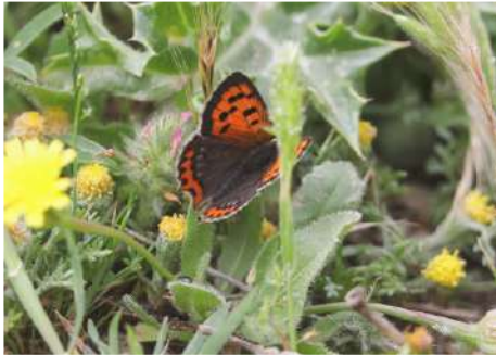
Mindre guldvinge Lycaena phlaeas