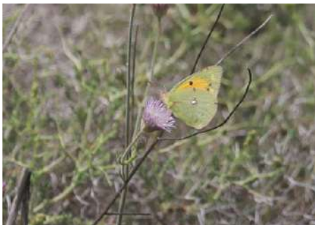
Rödgal höfjäril Colias croceus