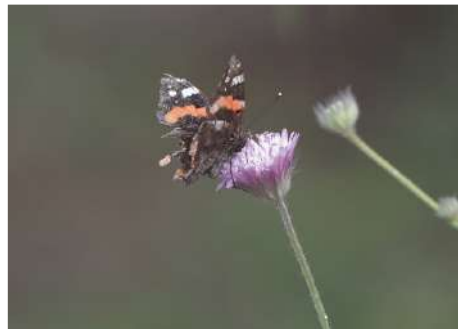
Amiral Vanessa atalanta