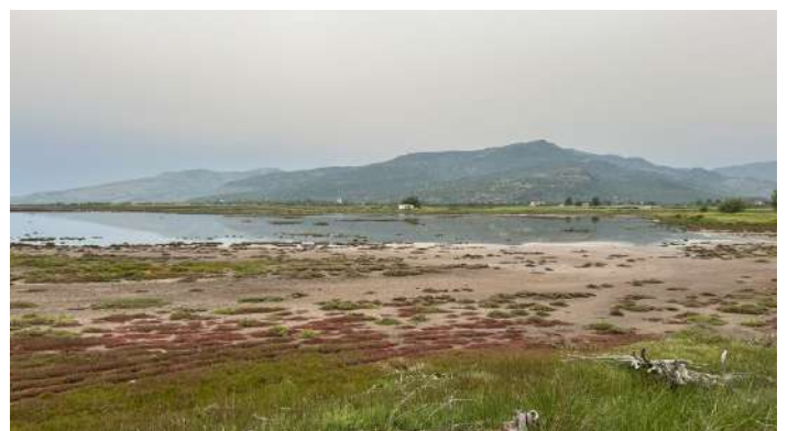
Christou River.

Vi fortsatte vandringen i skogen, med omgivande fält, som bland annat bjöd på hane av halsbandsflugsnappare, häcksparv, ett par fina masktörnskator och trädgårdsträdskrypare, samt en skarabé på en stor dyngboll. Dessutom lyckades en av deltagarna se en förbiflygande eleonorafalk, som blev fotodokumenterad. Efter fältlunch körde vi upp mot Napi i det bergiga området nordost om salinerna. Strax söder om Napi gjorde vi en vandring till en antik stenbro ("historic stone bridge"), vilket resulterade i observationer av bland annat balkanmes, rödstrupig sångare, rostsparv och mästersångare. Lite rovfågelspaning vid Napi-dalen gav ett antal ormörnar, ormvråkar och korpar, som seglade i de friska vindarna. Några kilometer sydväst om Mandamos körde vi in på mindre vägar, som förde oss genom ett lite kargare och bitvis stenigt, pastoralt landskap ("Plantania"), med spridda ekar, olivträd och en lite större skogsdunge. En kör av sommargyllingar hördes och strax upptäckte vi dessa vackra fåglar, som satt helt öppet i träden. Biätare hördes och sågs, liksom härfågel, turturduvor, samt rödhuvad törnskata och östlig medelhavstenskavtta. Det blev en minnesvärd dag!