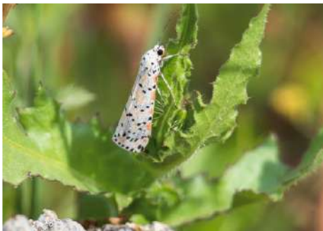
Kattunspinnare Utethesia pulchella