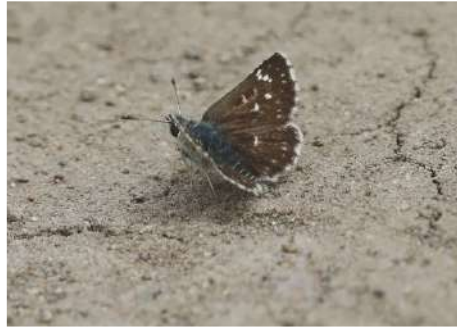
Orbed Red-underwing Skipper Spialia orbifer