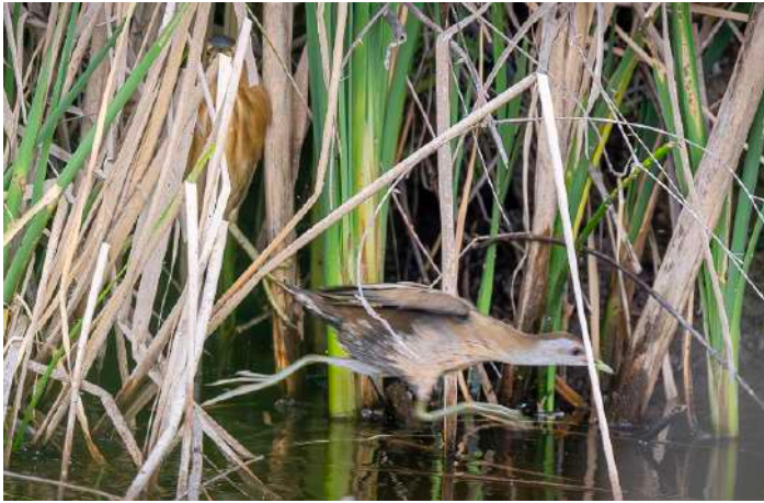
Mindre sumphöna och dvärgrördrom.

Söndag 28 april. Metochi-sjön, utcheckning och körning genom Mytilini till Charamida, flygplatsen/ hemresa.