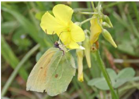
Sydlig citronfjäril Gonepteryx cleopatra