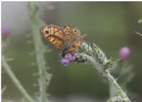
Svingelgräsfjäril Lasiommata megera