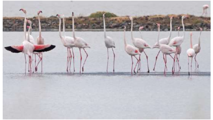
Större flamingo.

efterlängtd fika intill hamnen. Vi fortsatte norrut längs havet till Faneromeni, där några passade på att ta ett dopp i Medelhavet, medan några andra räknade antalet sträckande litor, som passerade lågt över havet ett antal hundra meter ut. Räkning gjordes under tre femminuterspass och i genomsnitt passerade ca 100 medelhavslitor åt söder per minut, medan enbart ett mindre antal sträckte norrut. Scopolilira var betydligt ovanligare med 2-3 ex per femminuterspass. Senare delen av eftermiddagen ägnades åt skådning i de små jordbruksfälten en bit innanför havet. Flera hanar av svarthuvad sparv sjöng från träd och buskage, förmodligen nyanlända från vintersemestern i Indien. Turturduvor, rödhuvade törnskator, ett par aftonfalkar och mängder med biätare sågs även i dessa fina marker.