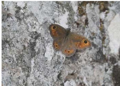
Vitgräsfjäril Lasiommata maera