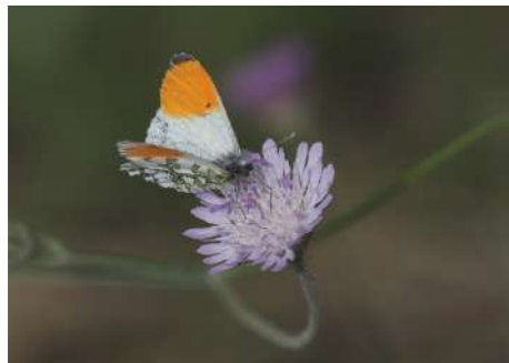
Aurorafjäril Anthocharis cardamines