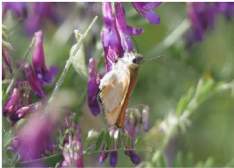
Större tåtelsmygare Thymelicus sylvestris