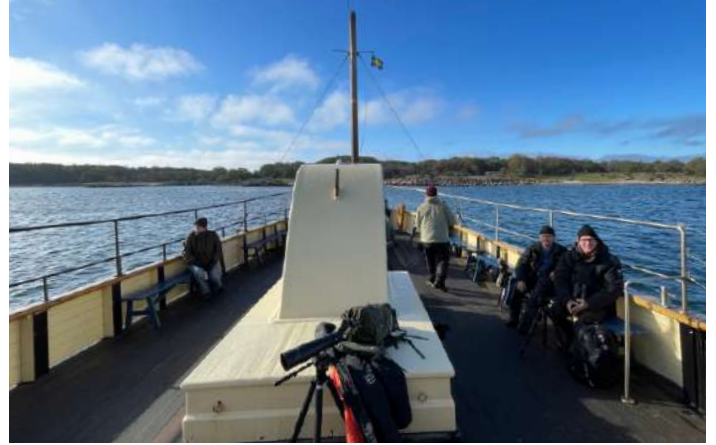
Ombord på Nanny mot Hallands Väderö.