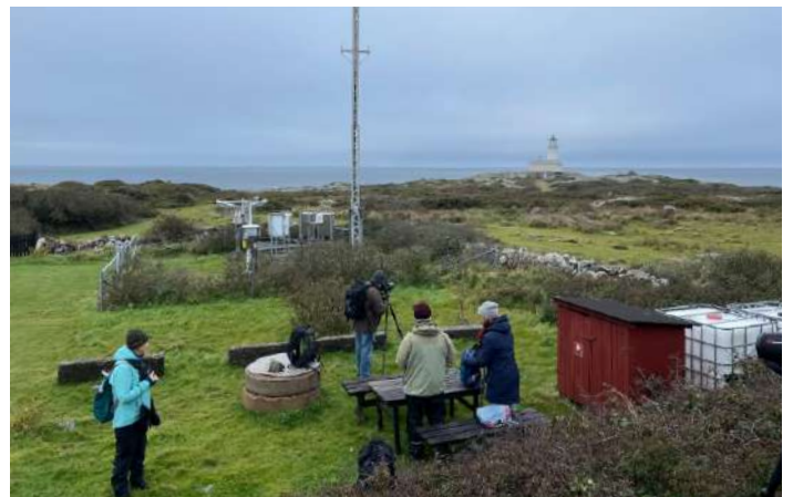
Hallands Väderö.