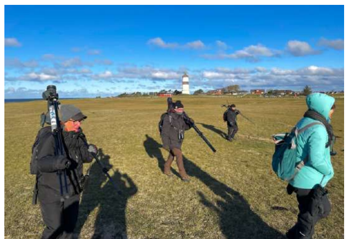
Vid Morups tånge/Korshamn.

En promenad söderut mot Korshamn gav fyra prutgäss, fyra sena tranor som sträckte över, och få men fina vadare i form av en flock kärnsnäppor, tre roskarlar samt en skärnsnäppa. Sedan blev det lunch som smakade extra gott i lä och solsken vid fyren!