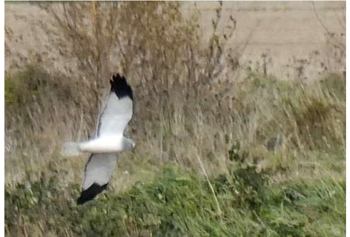
Blå kärnhök.