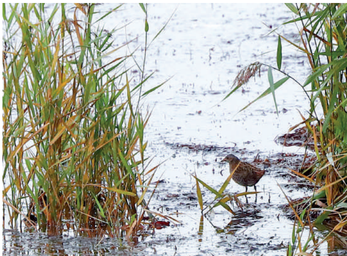
Småfläckig sumphöna.

Vädersidorna konsulterades, var regnar det inte? Det såg ljust ut mot SV så tillbaka till Skanör för lunch och kanske lite vadare. Men det regnade fortfarande så lunchen togs delvis inne bilen. Nu verkade det som om det inte regnade en bit in landet så vi drog mot Havgårdssjön. Här var det nästan lite sol ibland så vi började torka lite grand! En del ormråk, nån lärkfalk, en havsörn och en myckenhet av glador höll oss någorlunda sysselsatta. Jesper tog på sig ansvaret att dryga ut vår artlista och gick iväg för att spela in en kungsfågel, vilket han lyckades med. Lite våta och frusna var det dags att bege sig till hotellet där vi framåt kvällen avnjöt ännu en god trerätters middag!