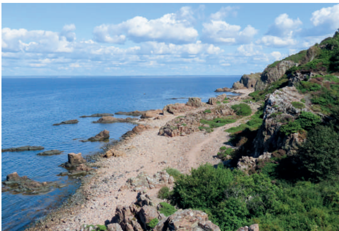
Hovs hallar.

Efter frukost rullade vi iväg mot Bjärehalvön i Skånes nordvästligaste hörn. Första stoppet var vid Vejbystrand där vi stod och spanade längs stranden och ut mot Skälderviken. Lite vadare bland stenarna strandkanten, bland annat ljungpipare och enkelbeckasin. Bra sträckrörelse på gulärlor, piplärkor och svalor, av de senare kom en ständigt ström av främst ladusvala svepande längs stranden. Lite längre upp, på strandängen, rastade ett tiotal buskskvättor och kanske fem stenskvättor. Långt borta över vattnet i riktning mot Kullens fyr upptäcktes en ensam havssula som flög runt lite och sen dök.