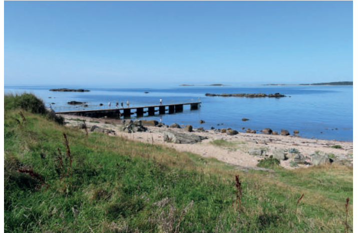
Torekov med Vinga och Hallands väderö.

Nästa stopp var sommarmetropolen Torekov, som väntat var vi inte ensamma här. Vi stod väster om hamnen och spanade i riktning mot Hallands väderö och snart lyckades vi hitta en gammal havsörn på toppen av ön Vinga, som ligger mellan Torekov och "Ön" som vi i närområdet säger. En knobbsäl låg på en sten och tumlare tumlade runt lite. Vi kompletterade morgonens tordmule vid Vejbystrand med sillgrissla och tobisgrissla här. Även här såg vi några toppskarvar.