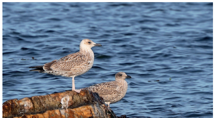
Kaspisk trut.

Tillbaks till Simrishamn för lite trutspan. Till en början var vi alla lite förvirrade men metodiskt och beslutsamt benade vi ut karaktär efter karaktär och snart var vi på det klara med vad som var gråtrut, havstrut och att det fanns en kaspisk trut där. Det senare konfirmerades också med bild till David Erterius. Dagen avslutades med en god trerätters middag på En Gaffel Kort-Maritim.