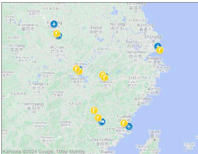
Fågellokalerna under resan. Se dag-för-dagprogrammet.

Jättestaderna Fuzhou och Shanghai samt Wuyan som är mindre och där mer traditionell bebyggelse finns.