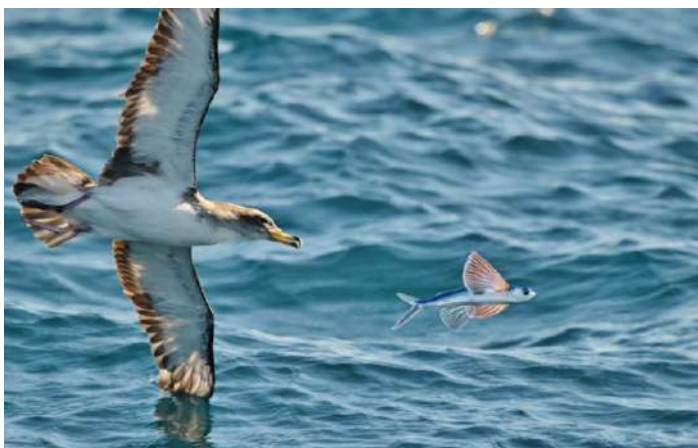
Scopolilira och flygfisk.

Redan på väg ut i sundet möttes vi av ett gigantiskt stim av flygfisk som attackerades av en familjegrupp sadeldelfiner och närmare tusen gulnäbbade/scopolilior. Den absoluta majoriteten var scopolilior, med enstaka gulnäbbade insprängda.