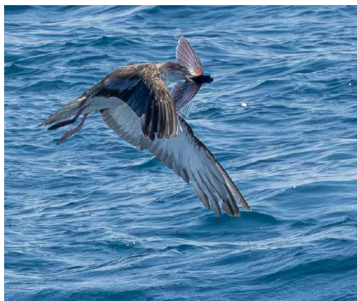
Scopolilira och flygfisk.

Resten av båtturen ägnades åt att leta upp och titta på några familjegrupper av flasknosdelfin och grindval. Även om det naturligtvis gav oss en viss valfrossa bleknade det i jämförelse med den första kvartens galenskap. Middag på hotellet.