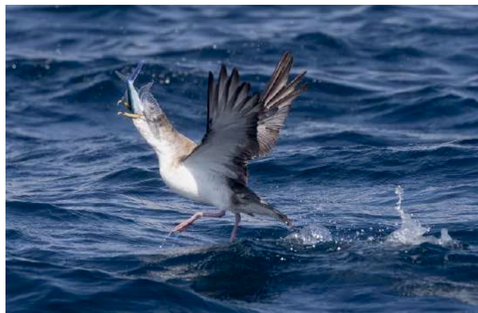
Scopolilira och flygfisk.

Band av baleariska liror deltog och drog sedan vidare. Vi satt bokstavligen mitt i denna våldsamma "feeding frenzy". Enligt Javi var detta unikt och något som han själv aldrig upplevt trots hundratals resor ut i sundet. Kamerorna smattade och det var så spektakulärt att till och med alla icke-skådare skrek i kapp med oss. En makalös upplevelse.