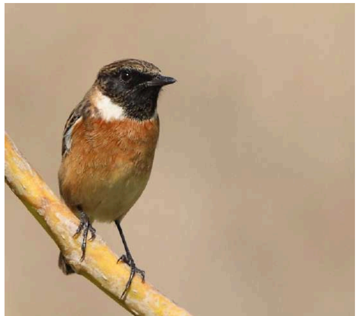
Svarthakad buskskvätta.

Efter knappt två timmars körning landade vi Algarrobo, den lokal som passar bäst för rovfågelsträck över Gibraltar vid västvindar. Det var ganska magert på eftermiddagen, men de första orm- och dvärgörnarna flög förbi. En häcksparv sjöng några strofer och en flock biätare passerade söderut. Efter att vi installerat oss i rummen blev det middag på hotellet.