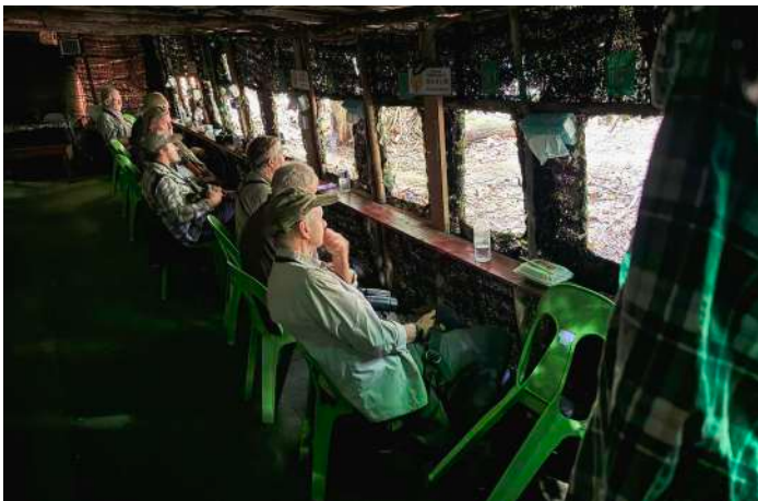
Trusmadi Hide.

Framme vid hotellet, här fanns ingen restaurang utan det blev "middag på stan".