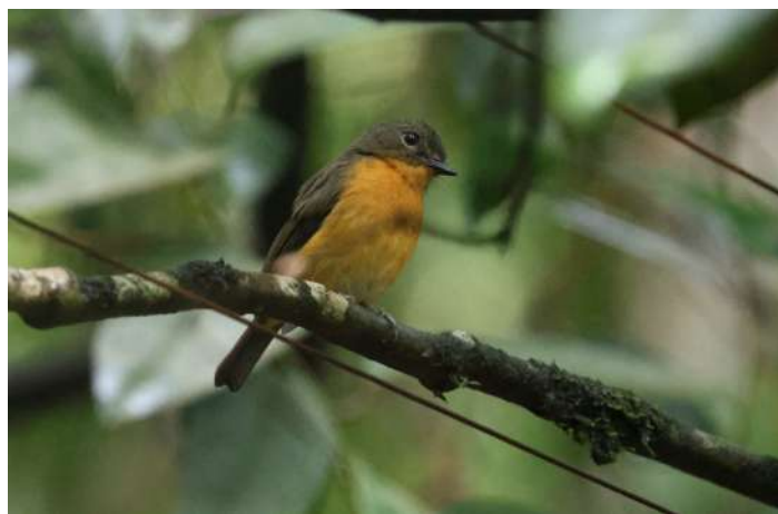
Dayak Blue Flycatcher.

Under eftermiddagen promenerade vi längs vägen igen, med obs av Green Iora, Asian Fairy Bluebird, Wallace's Hawk-Eagle, Mountain Imperial Pigeon och Brown-backed Needletail. Black Hornbill överflygande. Cream-eyed Bulbul, Crimson Sunbird, och Yellow-crowned Barbet noteras. En Indian Cuckoo hördes.