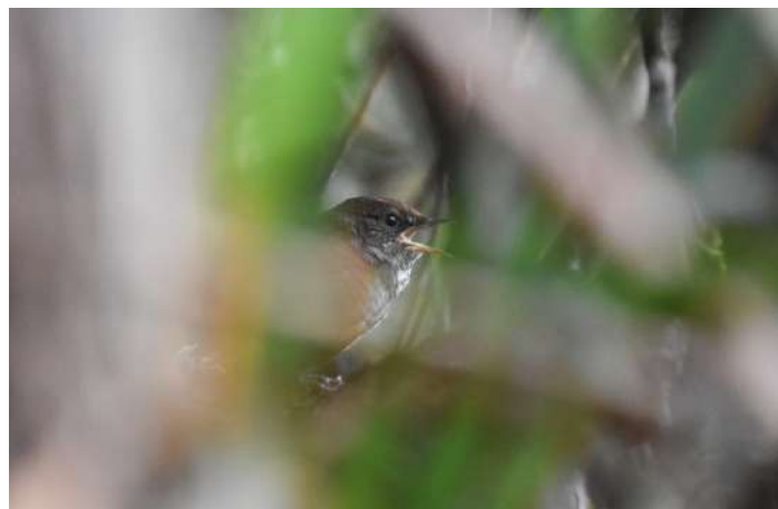
Friendly Bush Warbler.