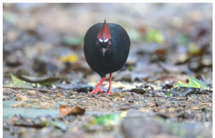
Crested Partridge.

Nöjda lämnar vi Trusmadi och åker vidare mot Bornean Jungle Girl Camp. Bussarna först och sedan omlastning till 4X4-jeepar. En timmas färd på lerig och guppig väg fram till campen. Inkvartering och lunch med efterföljande siesta. Flera skådar förstås och vi kan höra Great Argus ropa nere i dalen.