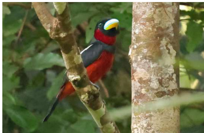
Black and Red Broadbill.

Tidig frukost. Iväg i mörkret mot gömsle nr 2, där vi installerade oss i gryningen. En Ventriloquial Oriole hördes sjunga, liksom en kör av Southern Grey Gibbon. Härlig ljudkuliss! Två små Leaflicker Babbler hoppade runt på matplatsen. Andrew visslade och strax kom en Bornean Banded Pitta fram, en hane. Den gör verkligen skäl för gruppsnamnet juveltrast! Den går runt en god stund och plockar i sig maggots, som lokale guiden lagt ut. Wreathed Hornbill flyger ut, vingslagen hörs tydligt! Pittan kommer fram igen! En speciell röst i ljudkulissen var Rail-babbler, som tyvärr inte vågade komma fram! Diard's Trogon hörs. Även White-necked Babbler hörs. En Buff-necked Woodpecker upptäcks när den sitter på en stam och hackar, strax kom en till och de hackade intensivt tillsammans!