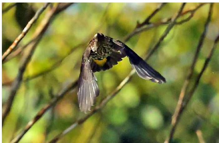
Whitehead's Spiderhunter.

Små korta stopp längs vägen gav: Grey-rumped Treeswift, Brahminy Kite, Scarlet-backed Flowerpecker och Oriental Dollarbird. Vid Tavin Springs såg vi Whiskered Treeswift, Charlotte's och Grey-bellied Bulbul. Brown Barbet och