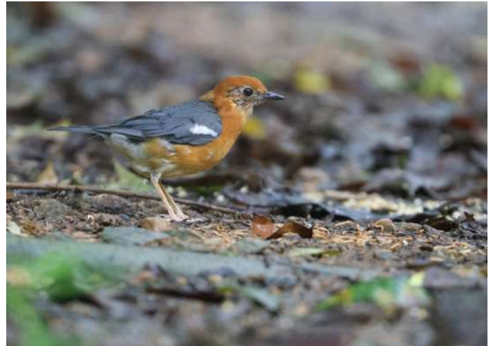
Orange-headed Thrush.

Framme vid Trusmadi Hide i gryningen. Här gick vi ner till stora gömslet. Golden-bellied Gerygone hördes från stigen ner. Fika innan vi fortsatte ner till det mindre gömslet, där vi skulle spana efter Bulwer's Pheasant. Gott om ekorrar framme och även en Large Treeshrew ses. Mountain och Golden-whiskered Barbet hörs liksom Cinereous Bulbul. En Common Emerald Dove kommer fram. Temminck's och Grey-throated Babbler ses också. Så kommer två honor Bulwer's Pheasant upp på matningen. Hanen ropar ganska nära. Vi kan urskilja tuppen där den går med sina uppfällda stjärtfjädrar, lysande vita, nere i slyet. Mycket diskret! Honorna kommer upp igen, men hanen håller sig kvar i bakgrunden.