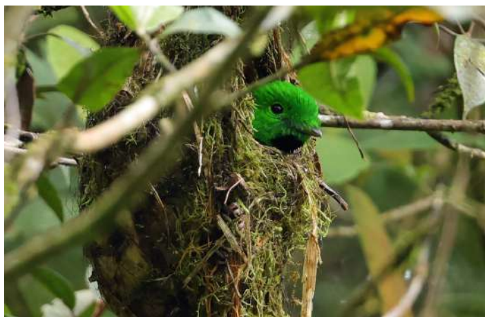
Whitehead's Broadbill.

Småregn. En stor flock med Mountain Blackeye kommer upp från dalen räknas till >105! Vi står under tak och väntar ut regnet och åker tillbaka till Liwagu-området. Där hittas Black-sided Flowerpecker och antligen en Fruithunter (hane)! En Hair-crested Drongo hängdes också in.