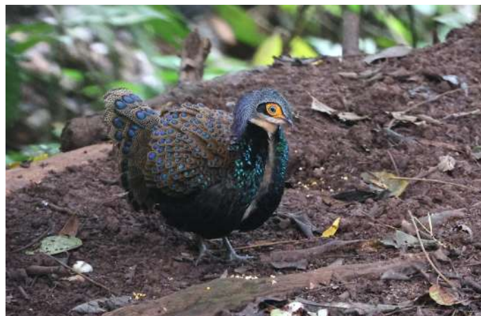
Bornean Peacock Pheasant.

Large Woodshrike visade sig också. Till slut kom vi fram till Telupid där vi bodde två nätter. Middag på restaurangen i samma kvarter.