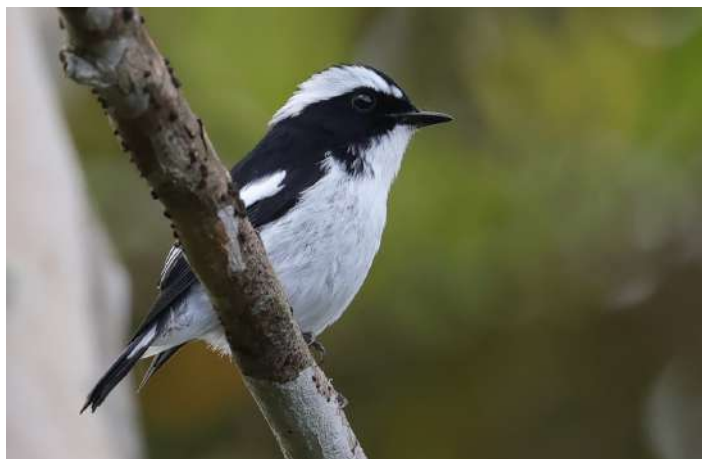
Little Pied Flycatcher.

I kvällsmörkret gick några av oss ut till de upplysta skärmarna och tittade på nattflygande fjärilar. Myller av många olika arter. Roligt. (Stora getingar var dock inte så roliga.)