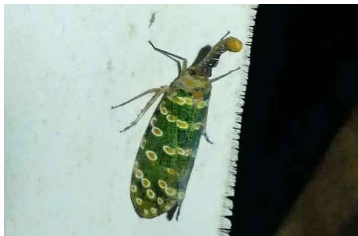
Pyrops sidereus.

Efter middagen går några fjärilsentusiaster ut till skärmarna igen. En vacker lyktstrit hittas på ett ställe, märklig varelse. Bestäms till Pyrops sidereus (endem för Norra Borneo). Mycket foton och många arter att bestämma hemma.