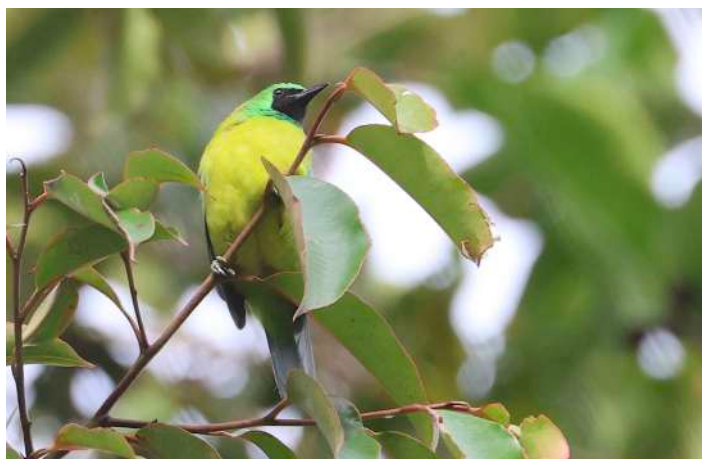
Bornean Leafbird.

I mörkret fann vår lokale guide en Yellow-bellied Prinia, som sov i gräset intill vägen. Sambarhjort noterades. Brown Wood Owl sågs fint i lampskenet. En oförglömlig obs blev att få se en Red Giant Flying Squirrel glidflyga över oss, upplyst av guiden! En liten Malayan Porcupine sågs i väggkanten. Bornean Small-toothed Palm Civet sågs i träd och en liten Banded Palm Civet hittades i gräset invid vägen. En Lesser Mouse Deer upptäcktes också i det torra gräset, svårsedd. En fin obs av Leopard Cat blev där den spanade på en orm som låg vid väggkanten. Kvällsturen avslutades med en flock sambarhjortar som håller till runt lodgen.