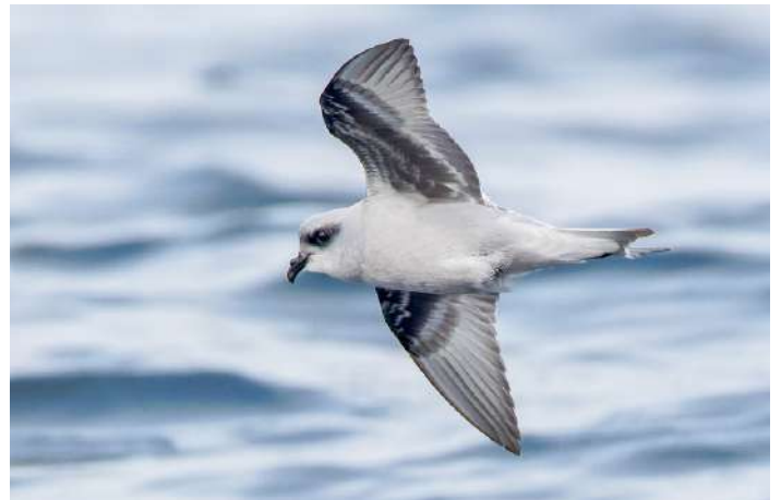
Fork-tailed Storm Petrel

31 augusti. Morgonskådning i närområdet beroende på vad vi sett, sedan färja till Nanaimo på Vancouver Island, med skådning efter fåglar och valar från färjan som korsar Georgia-sundet och tar två timmar. Natt i Nanaimo.