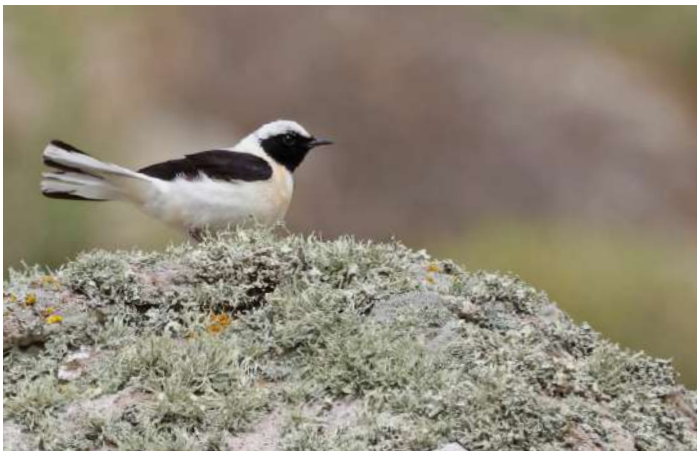
Östlig medelhavsstenskivvätta.

Vi fortsätter så småningom på den lilla kustvägen mot Eftalou och spanar av havet efter medelhavslira och scopolilira, samt medelhavstrut och toppskarv. Vi gör ett stopp nära havet, strax söder om Molivos, där vi tittar efter rastande småfågel, samt biätare med mera. Därefter vidare söderut och ett stopp vid "Raptor Point" för span efter rovfåglar och termik-seglande storkar med mera. Middag på hotellet och därefter besök i byn Skala Kalloni där vi hoppas få se tornuggla.