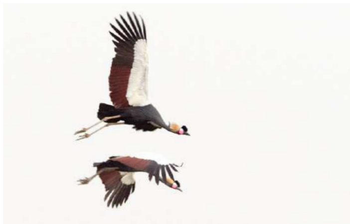
Black Crowned Crane

19 februari. En härlig heldag med skådning i Djoudj nationalpark hela dagen. Natt i Djoudj.