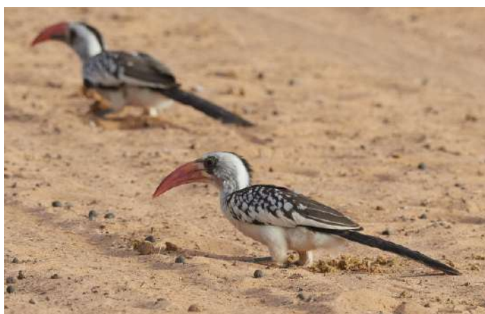
Western Red-billed Hornbill

20 februari. Tidig avresa på morgonen mot Touba fyra och en halv timme bort. Vår färd mot Touba sker genom en savann med spridda träd. Vi stannar och skådar där det passar och håller ögonen öppna för gamar, trappar och andra arter. Touba är ett stort religiöst centrum med en av Afrikas största moskéer som vi kör förbi. Övernattningssort: Touba.