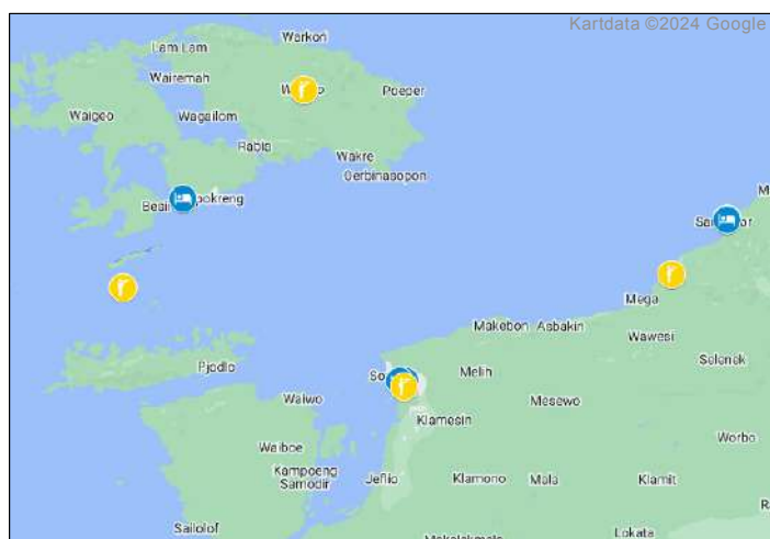
Fågellokalerna under resan. Se dag-för-dagprogrammet.

Vattnen kring Raja Ampat anses som bland världens bästa för dykning/snorkling.