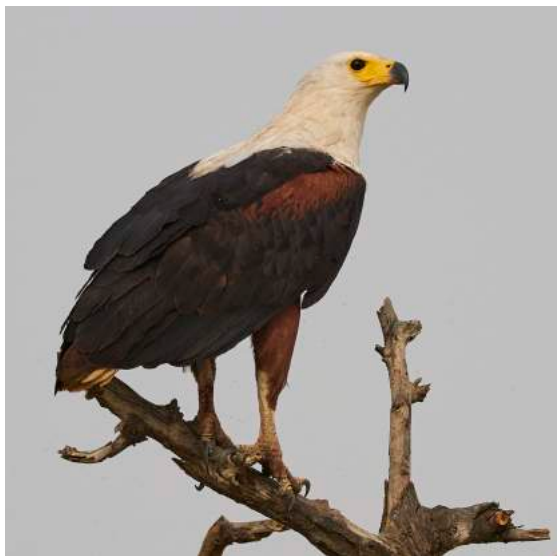
En ståtlig African Fish Eagle.

På eftermiddagen letade vi efter den mäktiga arab-trappen och fick efter en stund se en fågel smyga iväg och försvinna i vegetationen på lite håll. Några besök vid fågeltorn gav stora flockar av välbekanta arter som stjärtänder, årtor och skedänder. I den tilltagande sandstormen valde vi att åka tillbaka till hotellet, och på nära håll, utanför bussfönstret står plötsligt en fin arabtrapp alldeles intill vägen. En sensationellt bra observation av världens största trapp.