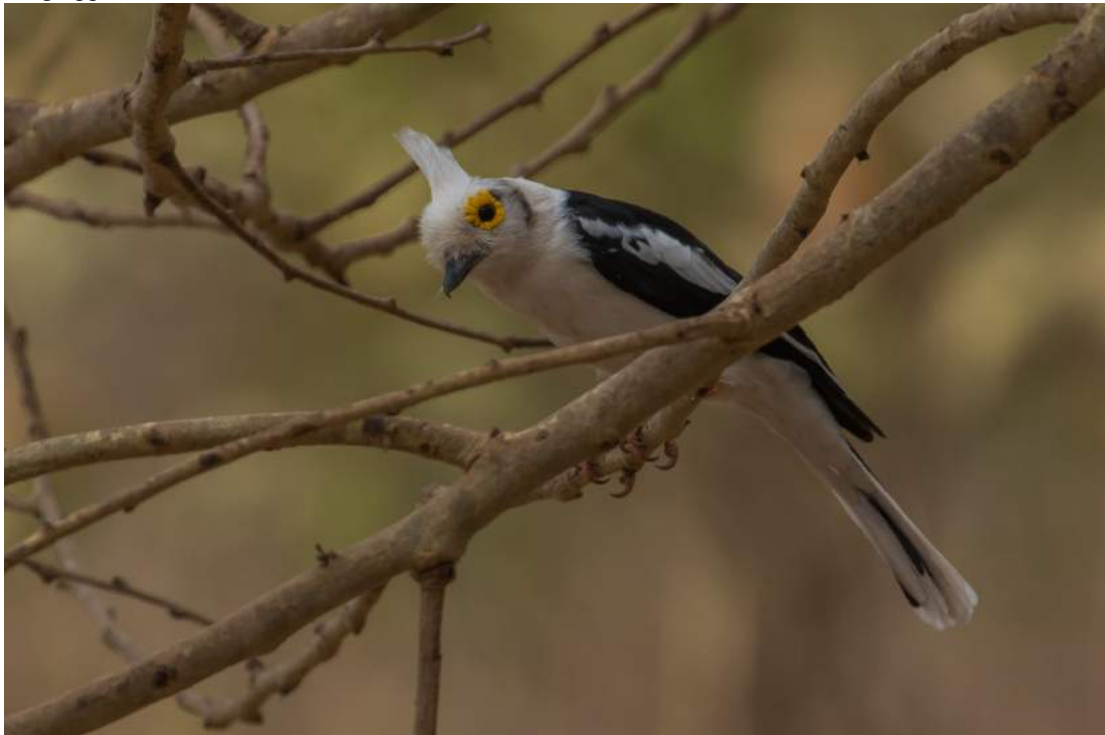
Bild. Den alltid så charmiga White-crested Helmetshrike.