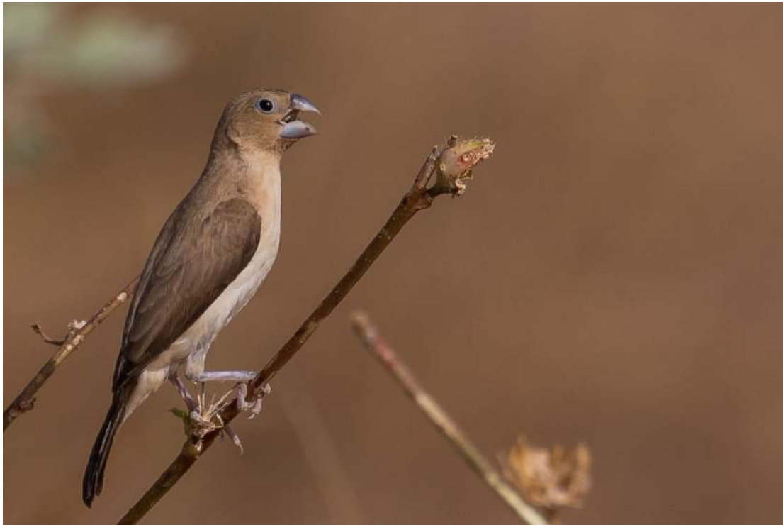
African Silverbill.