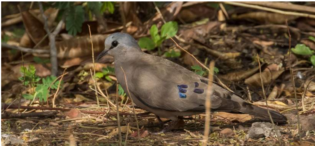
Black-billed Wood Dove.