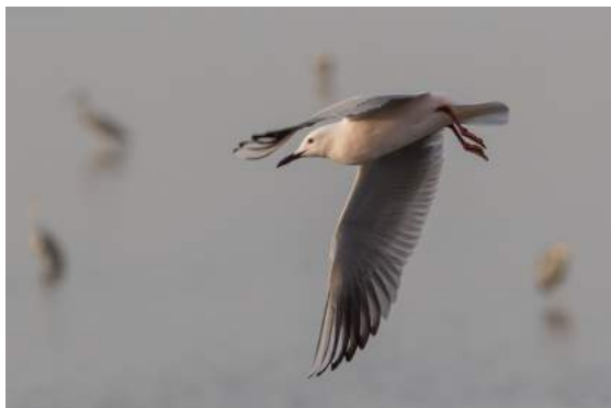
Långnäbbad mås i Saint Louis.

Efter en kort rundtur i Dakar för pengaväxling och letande efter fungerande bankomater åkte vi till Saint Louis med flera skådningsstopp på vägen. Vi såg en massa gamar förstås, fint att se att de inte är helt utrotade (ännu) från Västafrika, men också den märkliga kråkfågeln Piapiac, rödhuvad törnskator, Chestnut-bellied Starling och de första svarthuvad viporna och sporrvipor. Omelettlunch, den första av många, och läskedrycker intogs på en gatrestaurang i Mékhé. Mot skymningen kom vi fram till Saint Louis, den gamla huvudstaden under kolonialtiden och körde över på Pont Faidherbe, den 500 m långa kända metallbron, till vårt hotell som låg fint vid kajen mitt emot den stora fiskmarknaden. Folkmyllret kring fiskebåtarna på stranden var vilt fascinerande och något helt annat än den stilla kön vid fiskdisken därhemma.