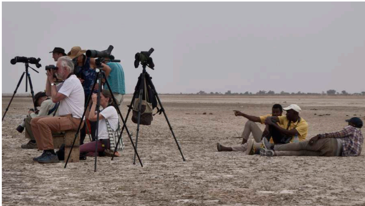
Spaning efter inflygande svalglador och rödfalkar.