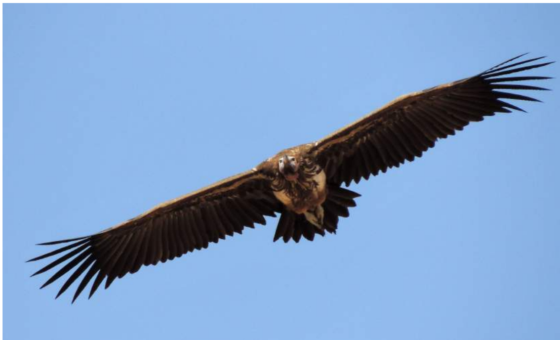
Den mäktiga örongamen.