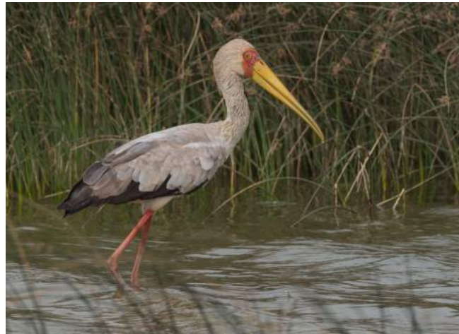
Yellow-billed Stork.