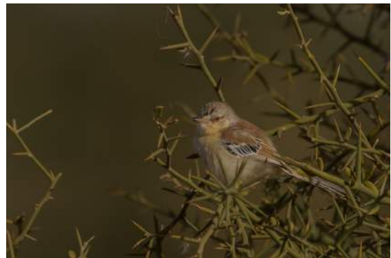
Cricket Warbler i akacia.

På eftermiddagen fortsatte vi skådningen i torrare marker öster om Richard Toll bland stenskvätör, rödhuvad törnskator, Red-billed Hornbills och en och annan rödstrupig sångare. Vi hade hoppats på att hitta en lokal sällsynthet med en begränsad utbredning i Sahel – en pungmes vid namn Sennar Penduline Tit – men det ville sig inte denna gång.