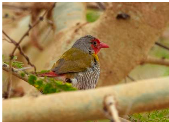
Green-winged Pytilia, en riktig skönhets.

På förmiddagen skådar vi söder om Kaolack och får se en Green-winged Pytilia bra. Här finns flockar av turturduva där det också gömmer sig en och annan Bruce's Green Pigeon. Vid ett vattenhål svärmar stora flockar av vävare. Efter lunch och siesta gjorde vi en tur öster om Kaolack nära en jordnötsfabrik, där den varma doften av jordnötter från de många lastbilarna med läckande säckar är påtaglig. Vi får se en Northern Crombec fint och får även bevittna spelande och parande svarthuvade vipor.