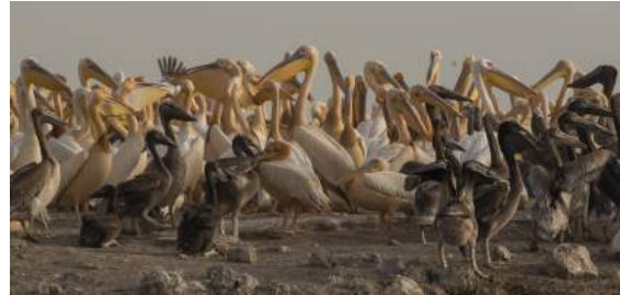
Delar av pelikankolonin i Djoudj NP.

infinner sig ett behagligt lugn i båten och vi njuter fullt ut av den afrikanska vildmarken.