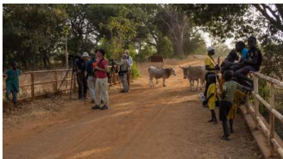
Skådning från bron vid den vattenfyllda bäcken.

Eftermiddagen blir synnerligen lyckad då vi hittar en liten vattenfylld bäck som nyttjas av skuggstorkar, jättekungsfiskare, och två arter Honeyguides. Vi fortsätter på en vandring i de öppna markerna och hittar snygga och häftiga Bearded Barbet och Swallow-tailed Bee-eater. Vid en läckande vattenkran på vägen tillbaka sitter några Hooded Vulture och dricker vatten.